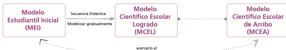
Figura 1: El MCEA se constituye como una hipótesis directriz a alcanzar mediante la secuencia didáctica sustentada en modelos y modelización.

El MCEL, alcanzado al final de la secuencia didáctica, puede ser comparado con el MCEA y con el MEI; logrando saber, entonces, si el modelo postulado como hipótesis directriz (MCEA) de la secuencia didáctica puede ser alcanzado y qué tanto fueron modificados los modelos iniciales de los estudiantes a partir de la misma (Figura 1). De esta manera, podemos validar la secuencia didáctica frente a lo que nos propusimos (MCEA) y no simplemente una transformación de la manera inicial de pensar de los estudiantes.