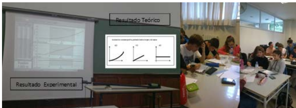
FIGURA 1. Distintos momentos del desarrollo de la actividad de articulación en el aula de matemática

Cabe mencionar que la experiencia realizada con el sensor de posición forma parte del primer laboratorio que los estudiantes hacen cuando cursan la asignatura Física I.