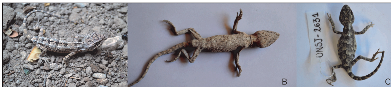
Figura 2. Vista dorsal (A) y ventral (B) del ejemplar hembra (LHC 79 mm; UNSJ-2630), y vista dorsal (C) del juvenil (LHC 44 mm; UNSJ-2631) de Leiosaurus paronae colectados en La Majadita, Valle Fértil, provincia de San Juan.

(Peracca, 1897; Gallardo, 1961; Cei, 1986, 1993). El ejemplar hembra examinado presenta una pequeña cresta nugal y dorsal sobre la línea vertebral, siendo más pronunciada en la región nugal, correspondiente a escamas cónicas puntiagudas; dorsolateralmente posee escamas cónicas pronunciadas que forman hileras irregulares. En la región cefálica se observan escamas irregulares prominentes y poliédricas. Ausencia de escamas rostral y mentoniana. Las narinas se ubican más cerca del hocico que de la región ocular. Ventralmente exhibe escamas subtriangulares imbricadas débilmente quilladas. Presenta escamas subdigitales tri a pentacarenadas y caudales evidentemente quilladas.