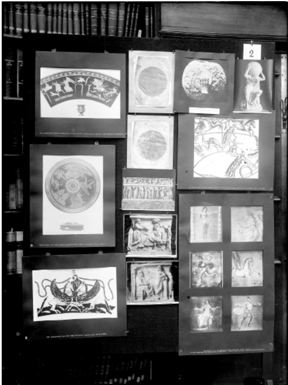
Figura 6. Panel 2 del Atlas Mnemosyne (1929)

del Atlas Mnemosyne ) que, dicho sea de paso, habían surgido del sistema pedagógico que Fritz Saxl presentó a Warburg a su regreso del sanatorio Kreuzlingen y que el primero usaba para impartir lecciones de geografía e historia al ejército austríaco (Gombrich, 2002) [Figura 6].