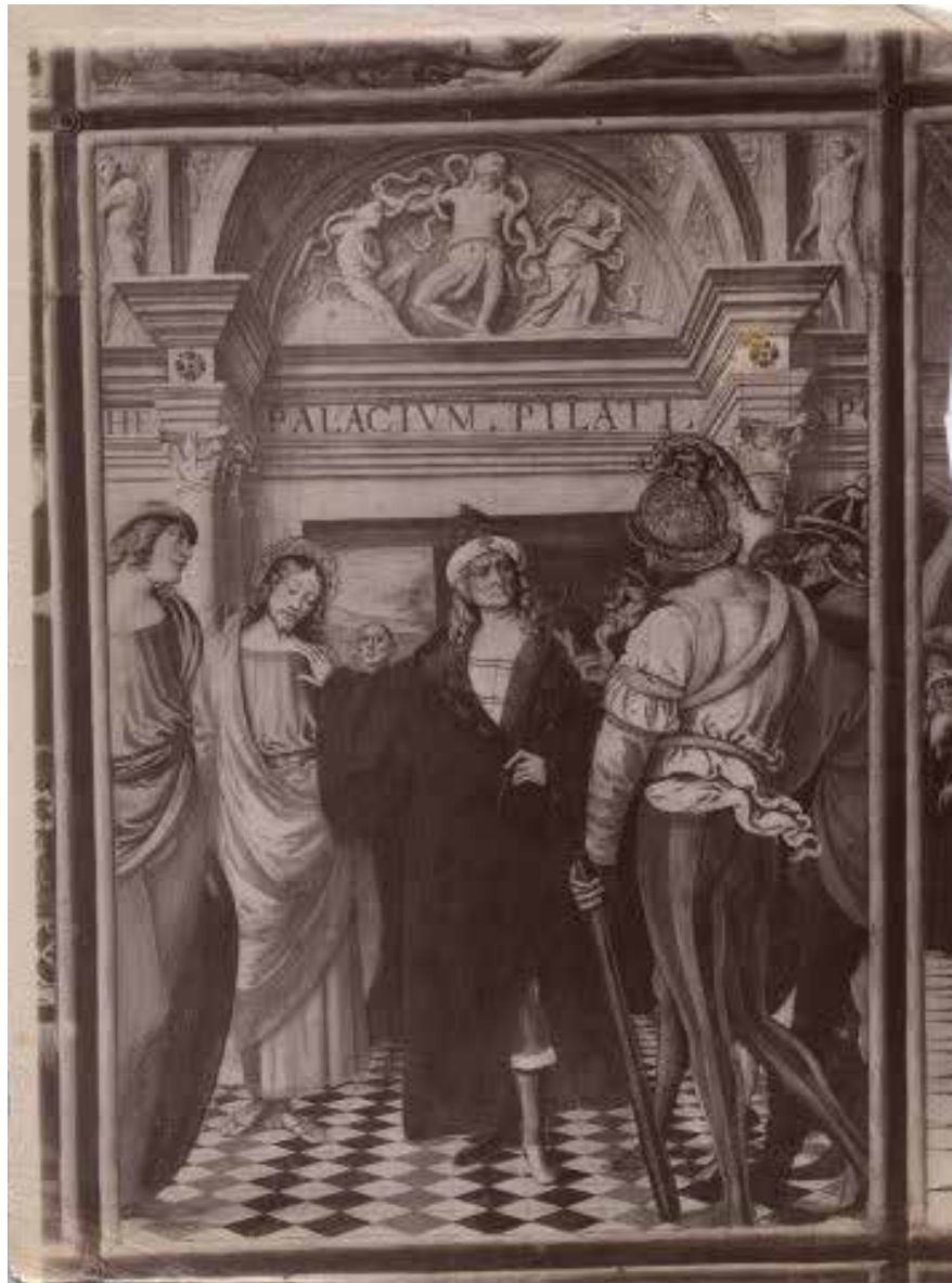
Figura 3. Cristo ante Pilato (detalle) (1513), Guadencio Ferrari. Iglesia de Santa María delle Grazie, Varallo

célebre grupo escultórico del Laocoonte y sus hijos que había sido descubierto en 1506. La referencia al sacrificio de Laocoonte, indicaba precisamente la penetración de aquel contrapunto de movimiento y de exageración escorzada. De esta manera, mientras que la grisalla mostraba cómo el sacerdote troyano y sus hijos se resistían a una muerte segura por estrangulación de las serpientes, debajo del relieve Cristo aceptaba el inevitable juicio de la humanidad con un imperturbable estoicismo. El patetismo de las formas clásicas se presentaba cerca de una expresión de aceptación hacia la muerte eminentemente cristiana [Figura 3].