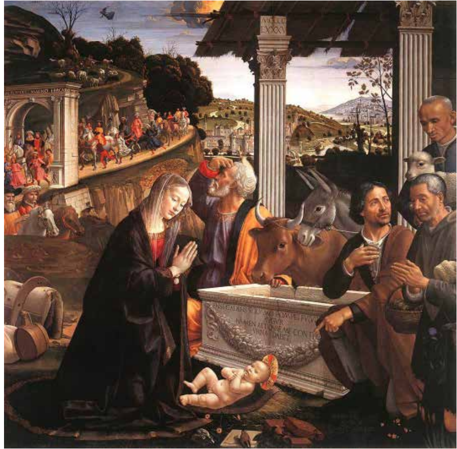
Figura 2. Adoración de los Pastores (circa 1490), Doménico Ghirlandaio. Capilla Sassetti, Iglesia de Santa Trinitá, Florencia

De esta manera, en el principal lugar de culto de la capilla se manifestaba tanto «[...] la nueva educación histórico arqueológica a la antichitá » como el lugar predominante de la antigüedad «[...] en el atrio de la construcción del mundo cristiano» (Warburg, 2014: 193). Si regresamos a la Pietá de Signorelli, que paradójicamente cierra el ciclo de la historia de Cristo, encontramos una composición similar aunque en este caso el patetismo dramático se encuentra manifiesto, como apuntamos, tanto en las figuras como en las imágenes que se presentan en el fondo, mientras que en el caso de la obra de Ghirlandario los personajes aún responden al tranquilo realismo del Quattrocento , limitando la influencia de la antigüedad a arquitecturas inanimadas. En este sentido, la pintura del altar de la capilla sería un caso del estilo mixto mencionado con anterioridad. En ese sentido, las dos obras comparten el problema de la grisalla. El fresco de Signorelli presenta la técnica como prueba de la deuda que las Pathosformeln tienen con la antigüedad, es decir una continuidad entre las ruinas y la escena.