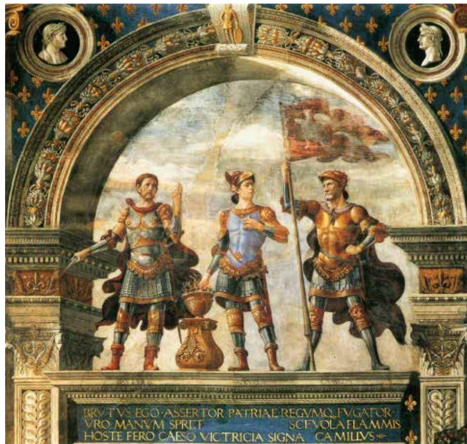
Figura 5. Bruto, Escévola y Camilo (detalle) (1491), Domenico Ghirlandaio. Palazzo Vecchio, Florencia

de la grisalla tipológica». Es destacable que los tres personajes sean romanos que encarnan valores republicanos: el asesino del César monárquico (Bruto), el héroe de las guerras contra la monarquía etrusca (Escévola) y el militar patricio, cinco veces dictador que vivió en los albores de la república romana (Camilo). Los tres personajes, salidos de la grisalla, son flanqueados por los bustos de dos emperadores que miran con perfil numismático la resurrección de estos héroes. Podríamos agregar aquí que, quizás, Warburg señalaba lo conveniente e intencional del resurgimiento de estos héroes en la belicosa república florentina y la distancia, habilitada de nuevo por la grisalla, que tomaban los artistas del período respecto al pasado imperial romano [Figura 5].