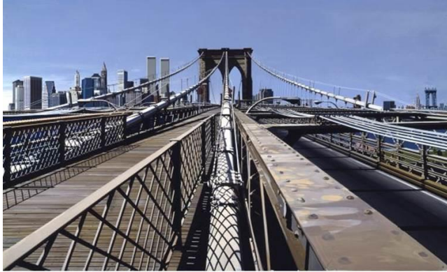
Fig.5 La representación hiperrealista en obras de Richard Estes (Brooklyn Bridge, 1993) y Alyssa Monks (Smirk, 2009)