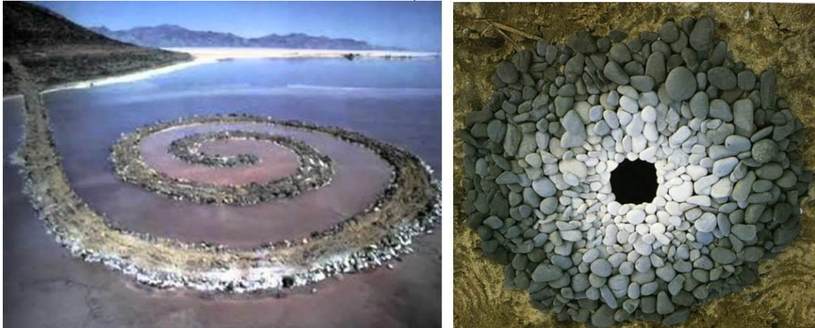
Fig.3 Comparativa entre el Land Art de Smithson (Spiral Jetty, 1970) y Goldsworthy (Pebbles around a hole, 1978)

Fuentes: https://www.khanacademy.org/humanities/art-1010/minimalism-earthworks/v/smithson-spiral-jetty-1970 , http://www.iamparagon.com/pebbles_around_hole/