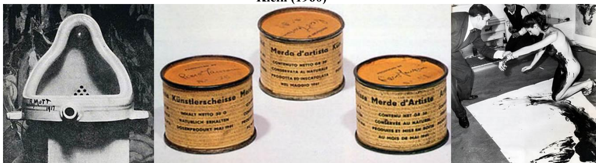
Fig.2 La Fuente de Duchamp (1917), Mierda de Artista de Manzoni (1961) y creación de las Antropometrías de Klein (1960)

Fuentes: Tomkins, Duchamp: A Biography , p.186, https://kuriioso.es/2008/06/09/ , http://minniemuse.com/2013/03/31/ikb/