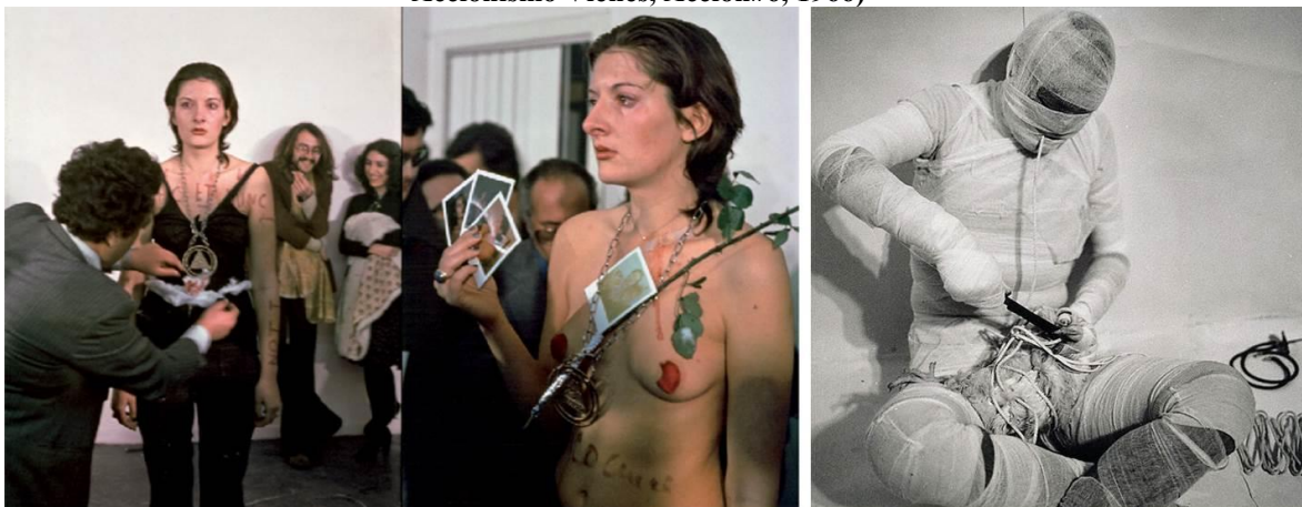
Fig.4 Experimentos radicales del Body Art, Marina Abramovic (El experimento,1974), Rudolf Schwarzkogler, Accionismo Vienés, Acción#6, 1966)

Fuentes: http://geronimototem.com/the-abramovic-arc/ http://www.tate.org.uk/research/publications/tate-papers/23/object-modernism-the-male-body-in-the-work-of-tatsumi-hijikata-gunter-brus-and-rudolf-schwarzkogler