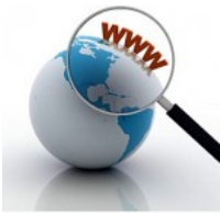
Herramientas de autor -Parte 1