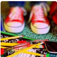
Howard Gardner: Aportes de la investigación psicológica a la educación actual - Parte II