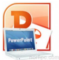
Las presentaciones con diapositivas