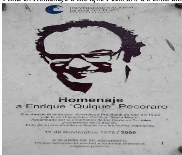
Figura 5. Placa conmemorativa colocada en el patio de la Universidad Nacional de Mar del Plata en Homenaje a Enrique Pecoraro a treinta años de su desaparición forzada.