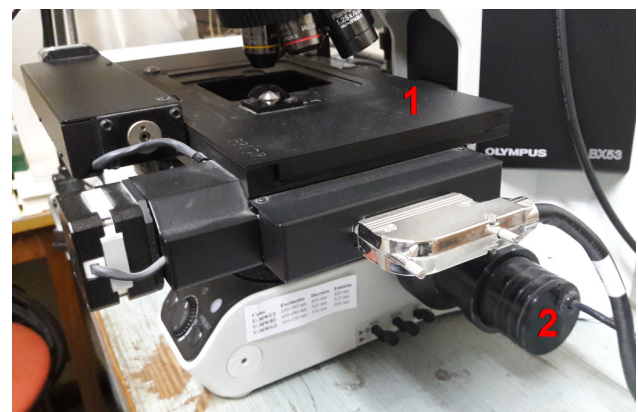
Figura 1. Detalle de la platina motorizada. Microscopio de campo ampliado, directo, en la que se instalaron una platina motorizada (1) que controla los ejes X e Y y un dispositivo para movilizar la platina en el eje Z (2).