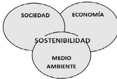
Figura 1. Dimensiones de la Sostenibilidad

propuesta conceptual que articula tres dimensiones: la social, la económica y la medio ambiental. Dentro de estas dimensiones se abarcan temas como la equidad social, las oportunidades de empleo, el desarrollo económico y el acceso a bienes de producción, los impactos ambientales y la calidad ambiental, la igualdad de género, el buen gobierno corporativo, entre otros más, considerándose tanto aspectos cuantitativos como cualitativos del desarrollo.