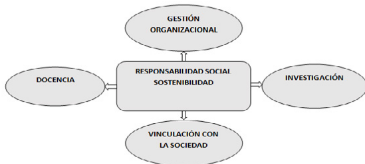
Figura 3. RSE, Sostenibilidad y funciones sustantivas de la Universidad

En base a la propuesta relacionada a la integración de los impactos 7 , stakeholders y las funciones sustantivas de la Universidad, es necesario e imprescindible declarar las acciones correctivas a tomar en cuenta para generar Sostenibilidad, las mismas que se originan de los impactos producidos en