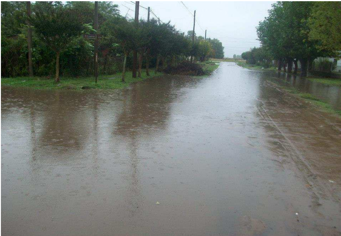
Inundación sufrida en Abril del 2013.