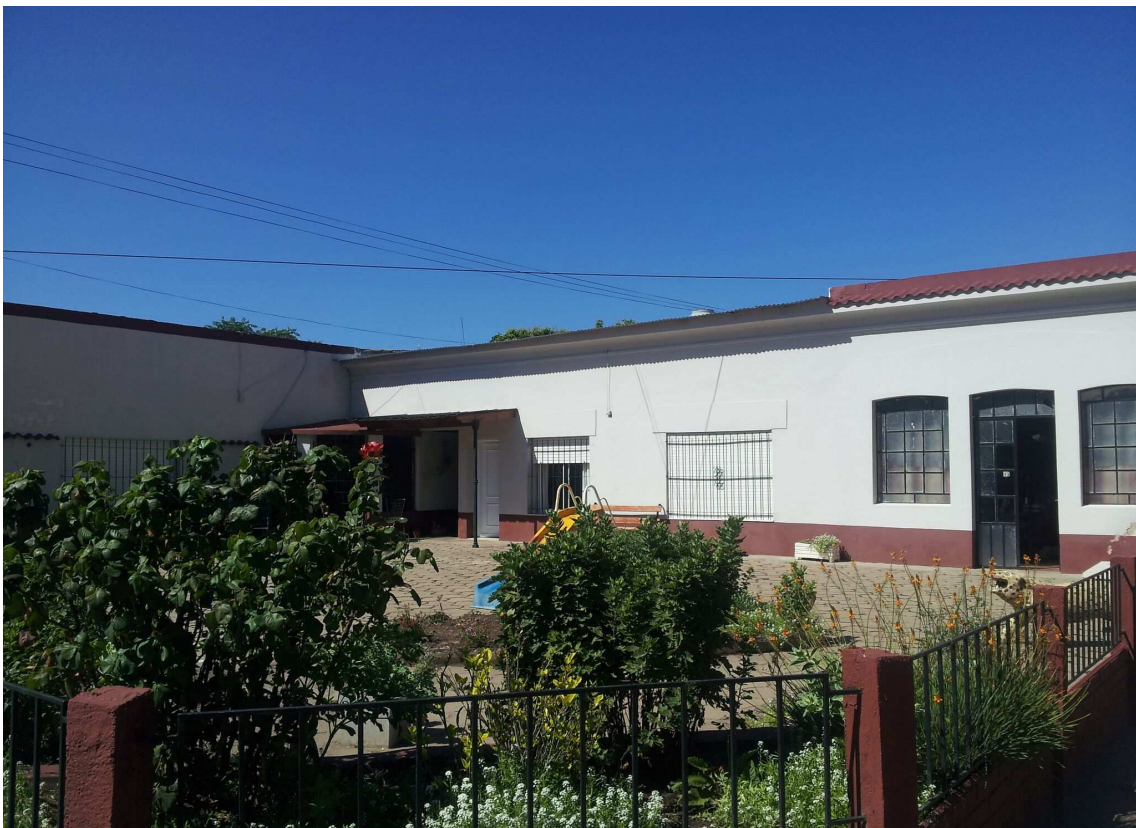
Casa de Teodora, una de las ecinas que brinda el sistema D&D.