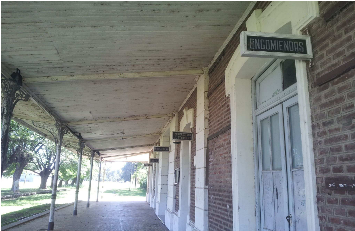
Edificio de la Estación de Trenes de Patricios.