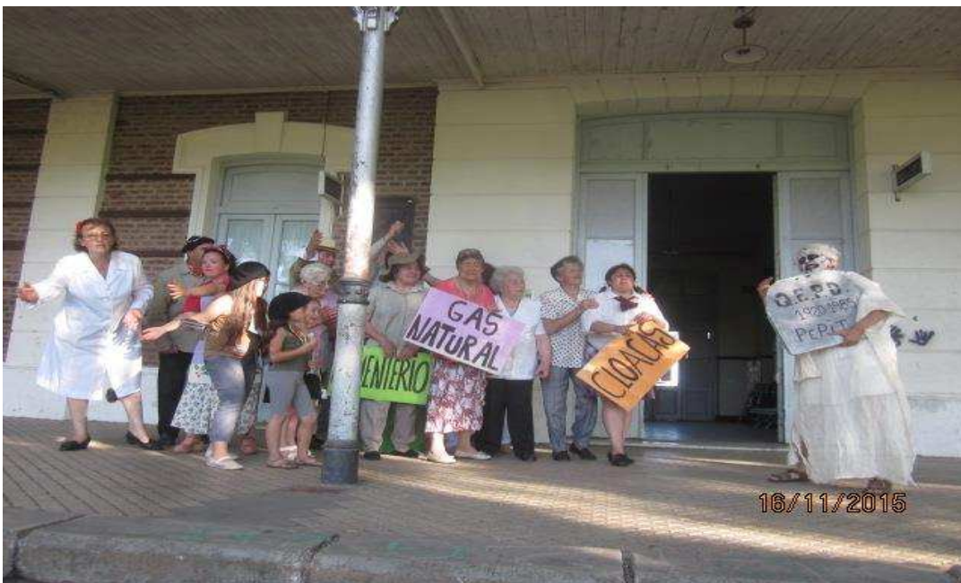
Teatro comunitario Patricios Unido de Pie, 15 noviembre, encuentro de folclore con grupos de San Justo, Ramos Mejia, R Castillo, Castelar.