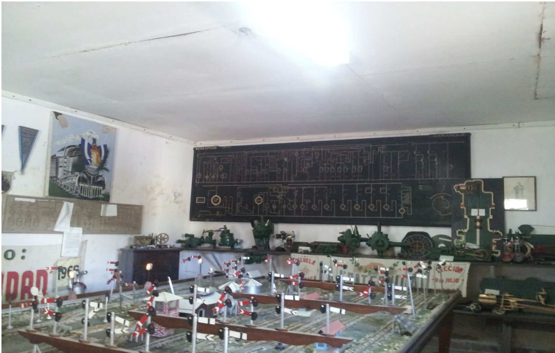
Museo ferroviario de patricios.