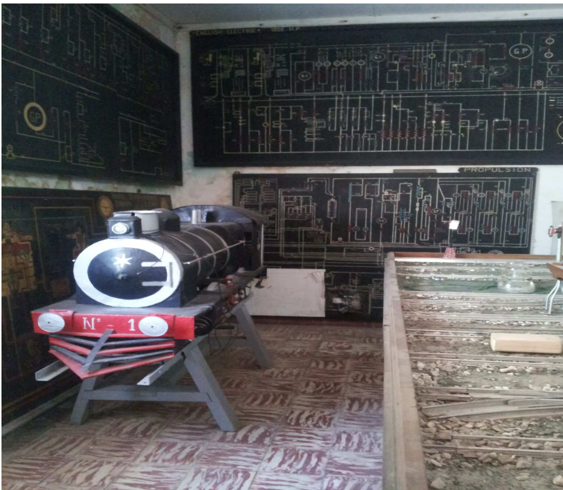
Museo ferroviario de patricios.