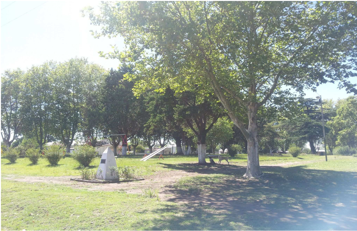
Plaza principal ed Patricios.