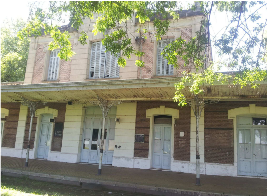
Edificio de la Estación de Trenes de Patricios.