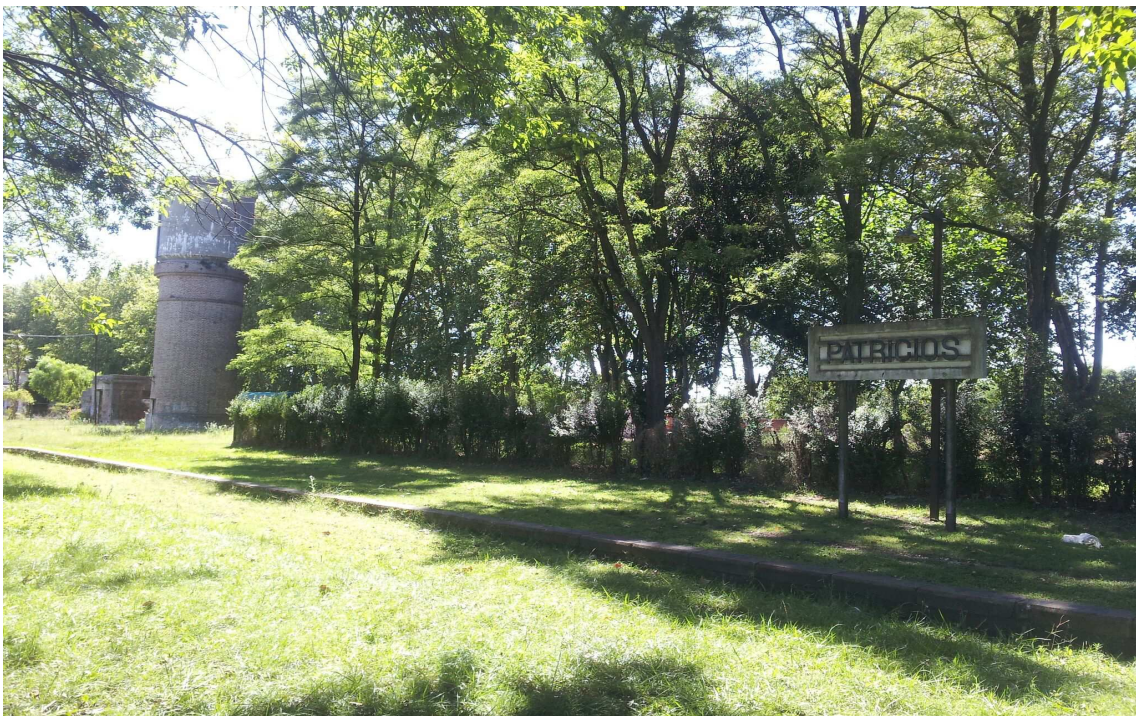
Estacion de Trenes de Patricios.