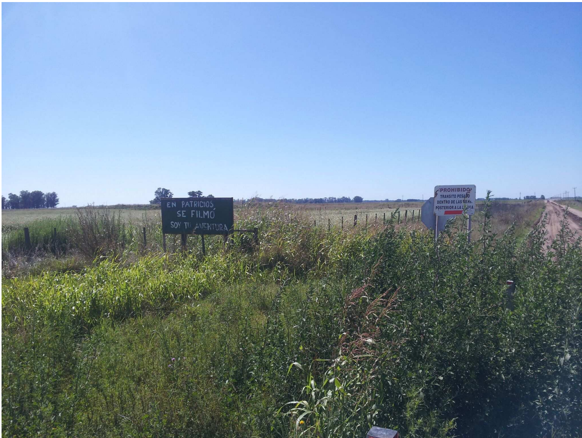
Cartel en la entrada de Patricios.