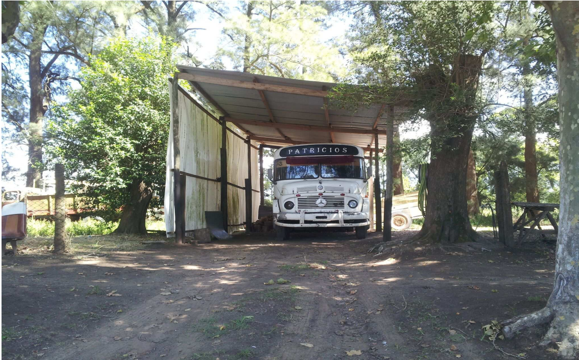
Colectivo de traslado de Patricios a la ciudad de 9 de julio. Fuente propia.