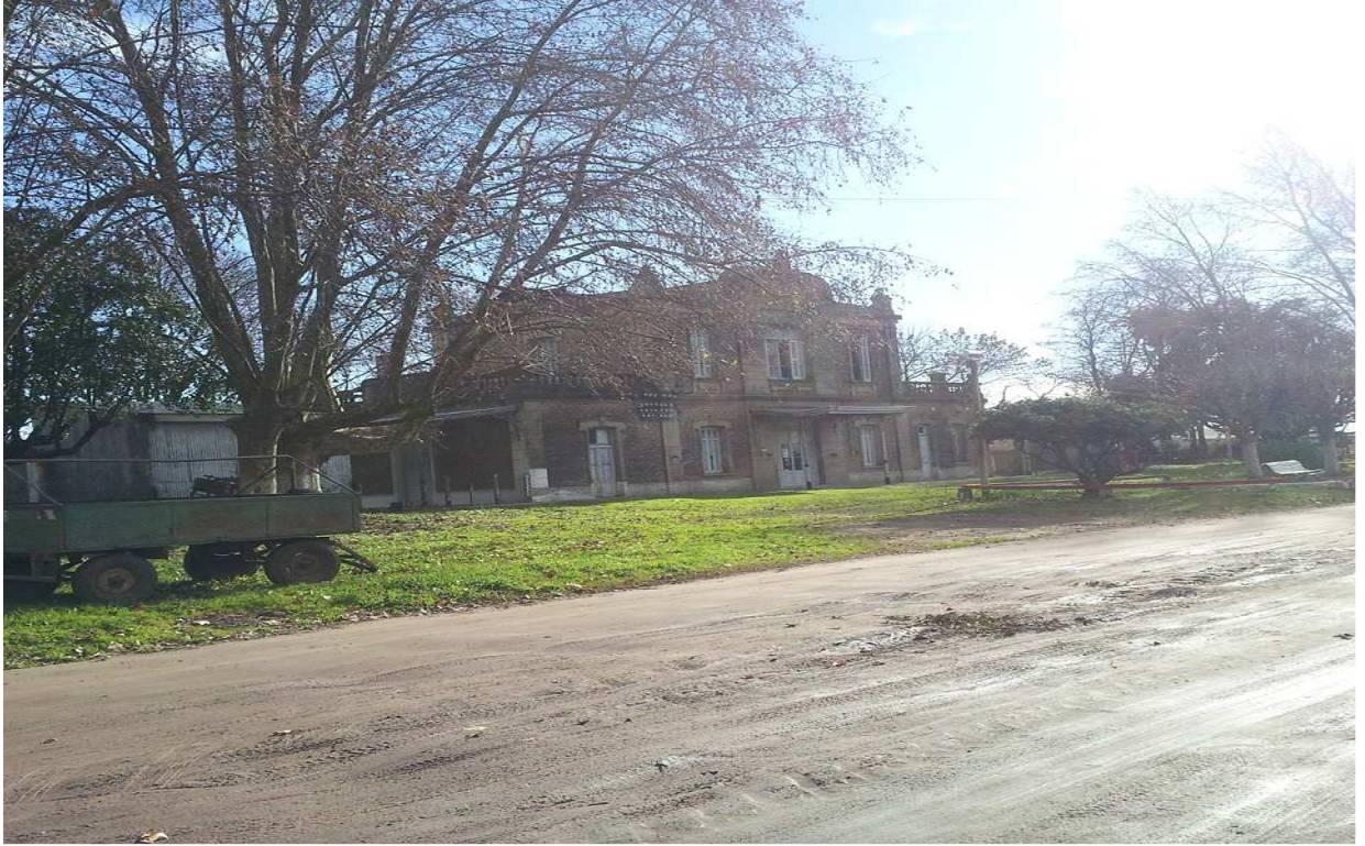
Edificio de la Estación de Trenes de Patricios.