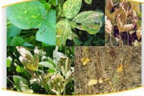
Síndrome de la muerte súbita

En estos últimos cuarenta años, coincidentes con el período de crecimiento del cultivo de la soja en la región, las enfermedades han tenido un protagonismo especial, con algunas epifitias que llegaron a provocar pérdidas totales en los lotes sembrados.