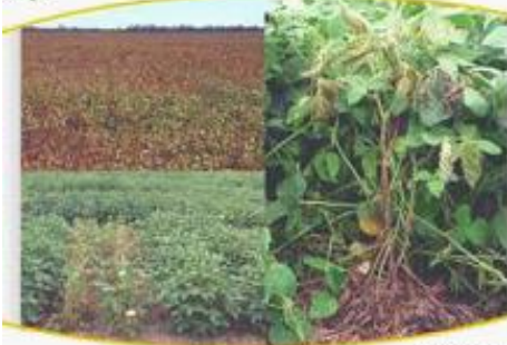
Cenosa del tallo