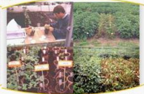
Evaluaciones en invernadero y campo