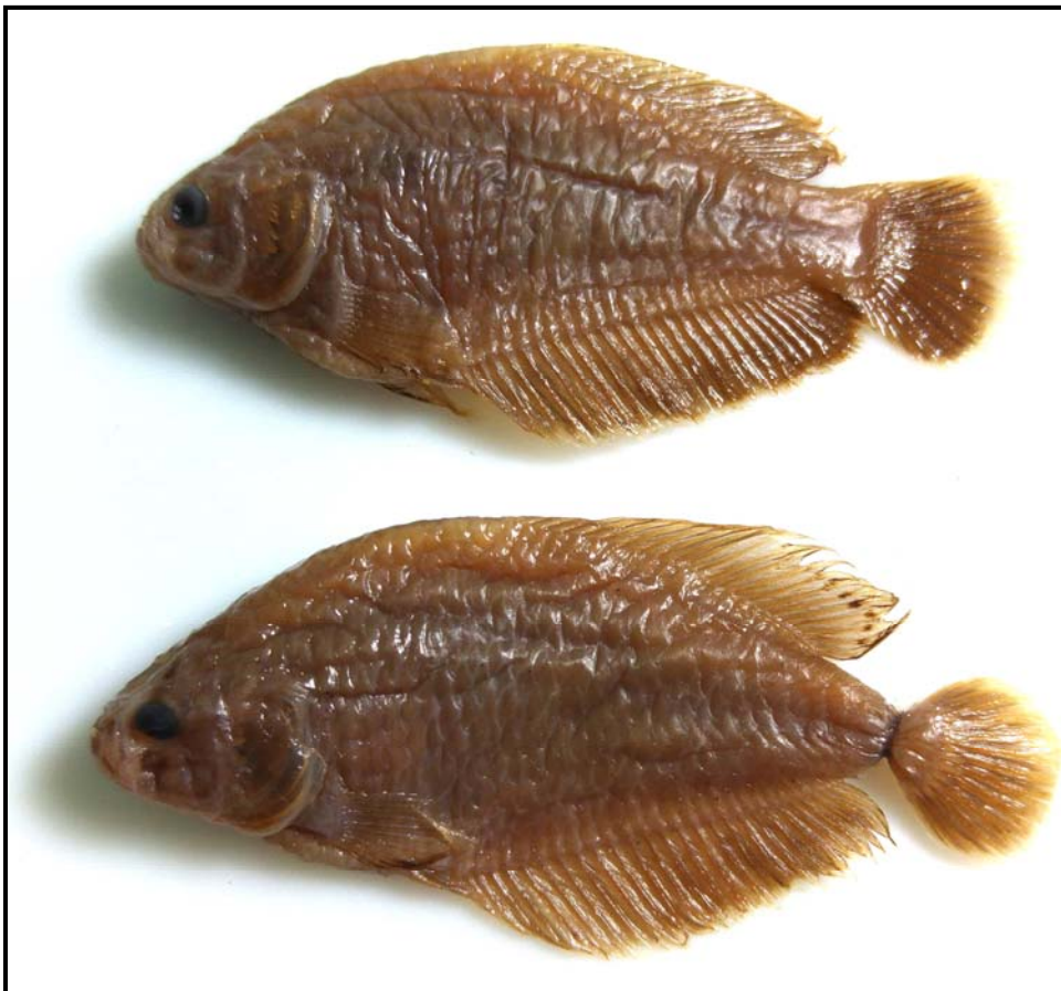
Figura 4. Austrolebias bellottii , MLP 3643, 2 machos, 39,5-49 mm LE; La Plata, Buenos Aires.