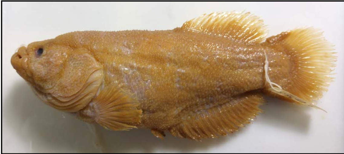
Figura 3. Austrolebias elongatus , MLP 1956, macho, 110,7 mm LE; La Plata, Buenos Aires.