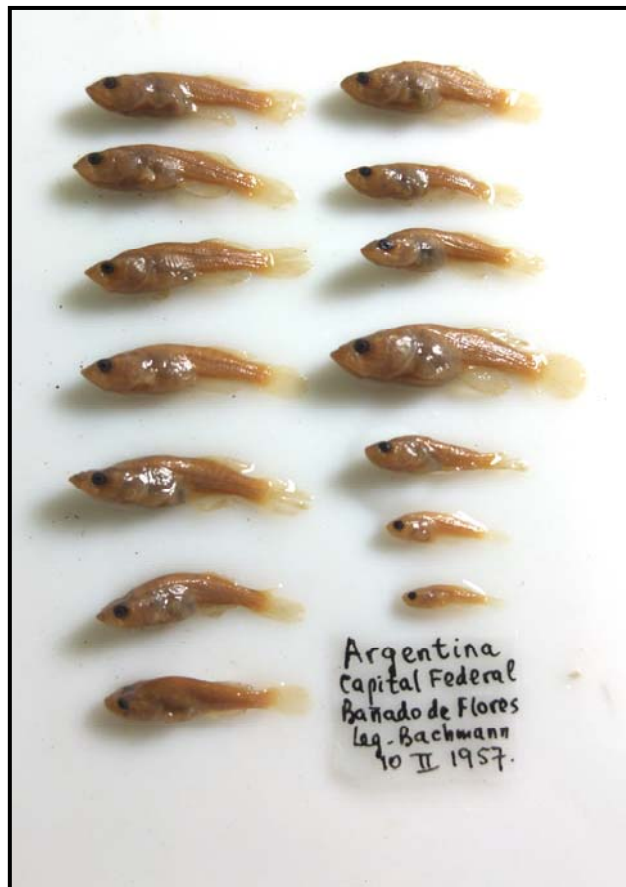
Figura 1. Austrolebias elongatus , MLP 7890, juveniles, 7,8-21,6 mm LE; Bañado de Flores, Capital Federal.