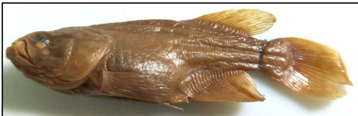
Figura 2. Austrolebias elongatus , MLP 3407, hembra, 62 mm LE; Gualeguaychú, Entre Ríos.