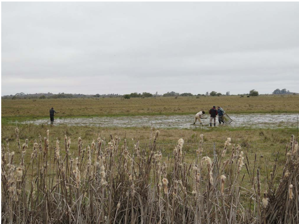
Figura 6. Ambientes temporarios de A. bellottii y A. elongatus ; Punta Indio, Buenos Aires. Agosto 2016.