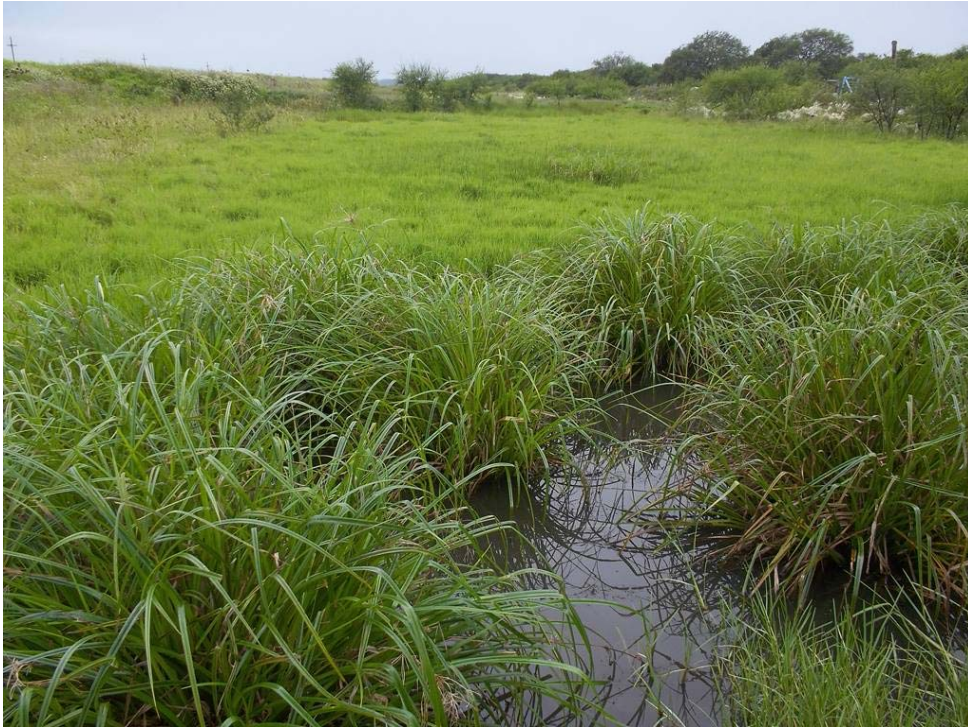
Figura 5. Ambientes temporarios de A. alexandri , A. bellottii y A. nigripinnis ; Ceibas, Entre Ríos. Noviembre 2011.