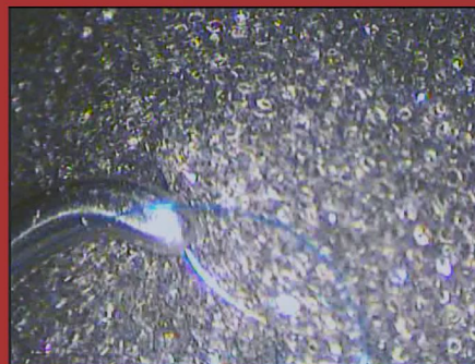
Punto en pulmón, entrenamiento con videotoracoscopy.

Se documentó mediante fotografía y video digital los procedimientos llevados adelante por los alumnos en el simulador y se evaluaron los aciertos y errores de los mismos. Luego fueron analizados por el instructor y los alumnos en conjunto.