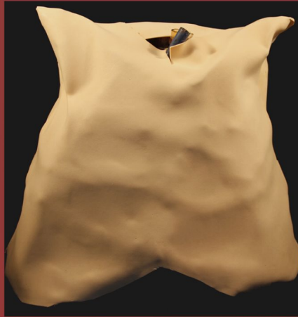
Simulador de tórax, vista externa.

Con el nacimiento de la cirugía laparoscópica en la década del 80, cuando De Kurt Semm realizó la primera apendicectomía laparoscópica, la técnica quirúrgica transita un cambio desde la cirugía abierta convencional a la cirugía mini invasiva o cirugía laparoscópica, que luego con la incorporación de nuevas tecnologías pasa a conocerse como videolaparoscopia. Esto genera lo que se conoce actualmente como cirugía en espejo, lo que amerita un entrenamiento especial y continuo por parte de los especialistas para su desarrollo. Para llevar adelante el entrenamiento en videolaparoscopia es fundamental contar con simuladores. En la videotoracoscopia donde los espacios intercostales son reducidos y la angulación que debe adoptar el instrumental impide un gran desplazamiento, el entrenamiento mediante la utilización de simuladores permite de manera óptima obtener las habilidades y destrezas necesarias para realizar la práctica quirúrgica.