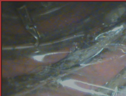
Paquete intercostal, marcación con pinza durante entrenamiento con videotoracoscopy.

Como métodos a utilizar se realizó una revisión y actualización del material bibliográfico en modelos de simulación, y también en videotoracoscopy. Se confeccionó un simulador utilizando material óseo existente para la práctica de técnicas básicas y avanzadas. Se procedió al entrenamiento de alumnos de postgrado en procedimientos torácicos básicos y avanzados, siguiendo un protocolo en donde los alumnos van avanzando en complejidad.