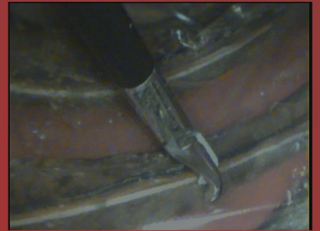
Paquete intercostal, detalle.