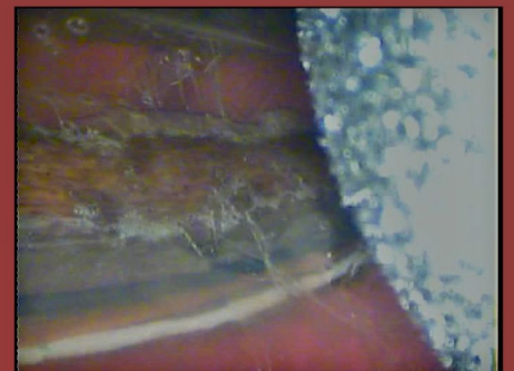
Pared torácica, cara interna. Costilla y paquete intercostal.