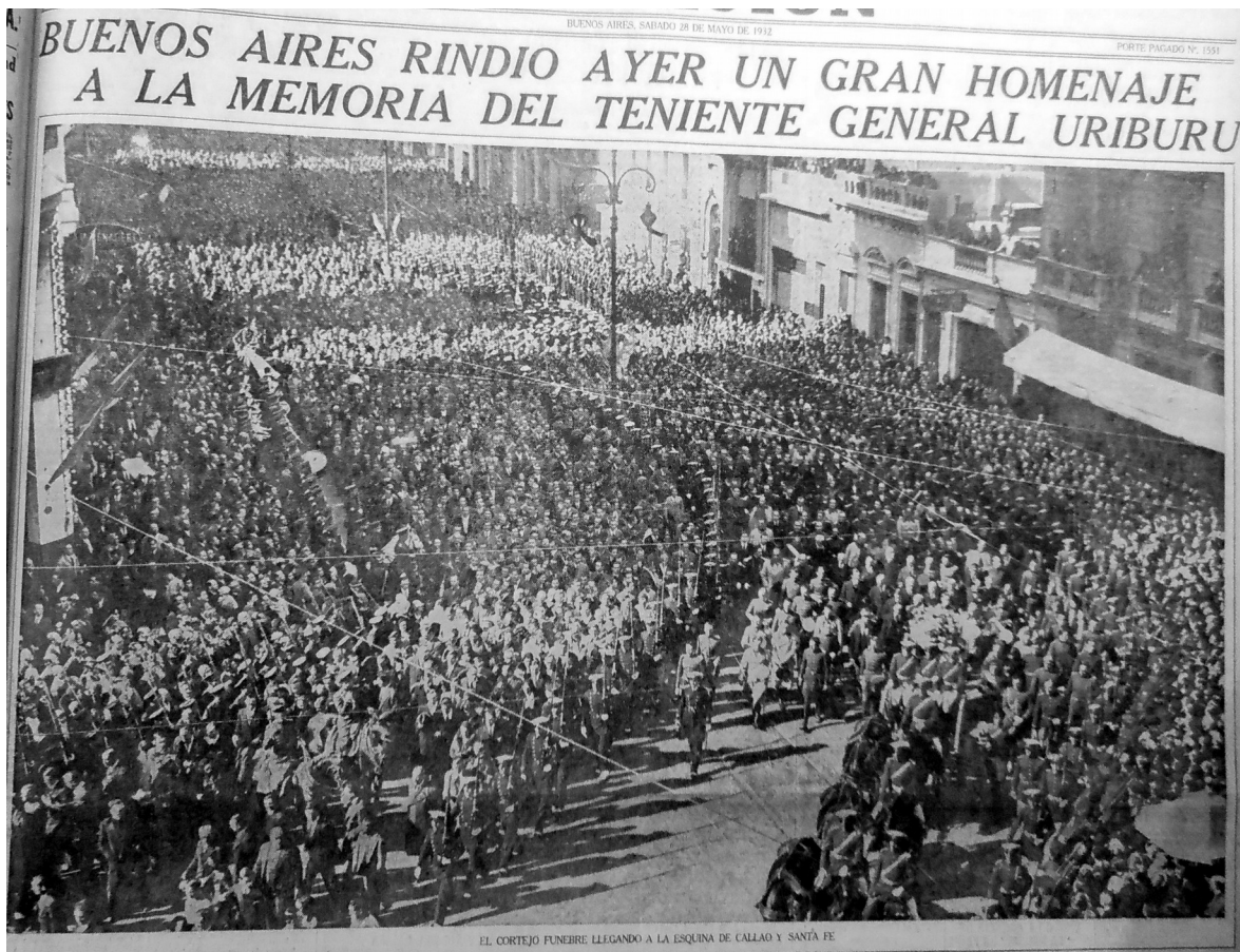
Figura 1: La Nación, 28 de mayo de 1932, p.1

Nunca antes una ceremonia fúnebre en la Argentina había contado con semejante despliegue del aparato militar. El funeral de estado de Uriburu fue muy distinto de los funerales de estado que, iniciados por la república francesa, se celebraron en la mayoría de los países de occidente. En estos las salvas y la guardia de honor militar no obstruían ni ocultaban el carácter marcadamente civil de la ceremonia. Miradas en perspectiva histórica, las exequias de 1932 inaugurarán una forma de conmemoración fúnebre que será habitual para los presidentes militares argentinos del siglo XX.