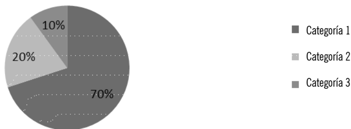
Tabla II. Objetivos, finalidades y valoración.

En estas preguntas se solicitó al profesorado que propusiera tres ejes acompañados de imágenes con los cuales planificarían una clase sobre la segunda guerra mundial.