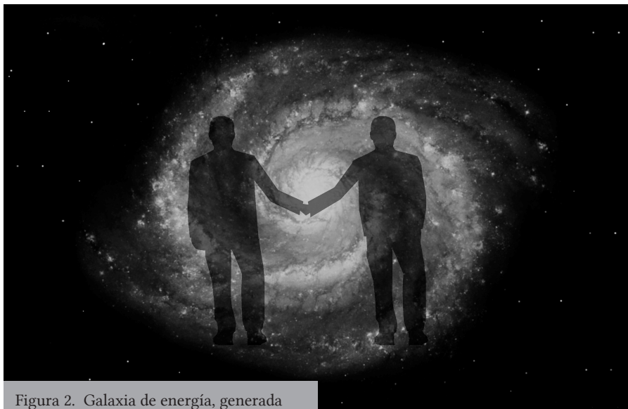
Figura 2. Galaxia de energía, generada por el contacto físico de dos usuarios. Proceso de intercambio energético

La instalación está acompañada de una ambientación sonora que muta según el comportamiento de las auras. Estos sonidos están en las frecuencias de ondas cerebrales: Beta, Alfa, Theta, Delta y Gamma, ya que se caracterizan por poner a las personas en estado de relajación y meditación.