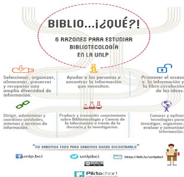
Fig. 1: Uno de los folletos de difusión elaborados por la Comisión de Difusión

Las acciones desarrolladas por la Comisión de difusión durante 2014 y 2015 fueron efectivas para lograr aumentar el conocimiento de las carreras de Bibliotecología, tanto dentro de la propia Facultad como en el resto de la Universidad y en el público en general, tal como se observará en el apartado de resultados alcanzados.