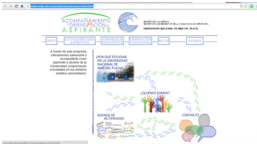
Fig. 1: Página web del Proyecto: http://www.mdp.edu.ar/academica/acceso/index.html

2) Finalidad ADMINISTRATIVA: Las inscripciones a las actividades se realizaron a través de la página web del programa, mediante el empleo de formularios de Google diseñados para tal fin.