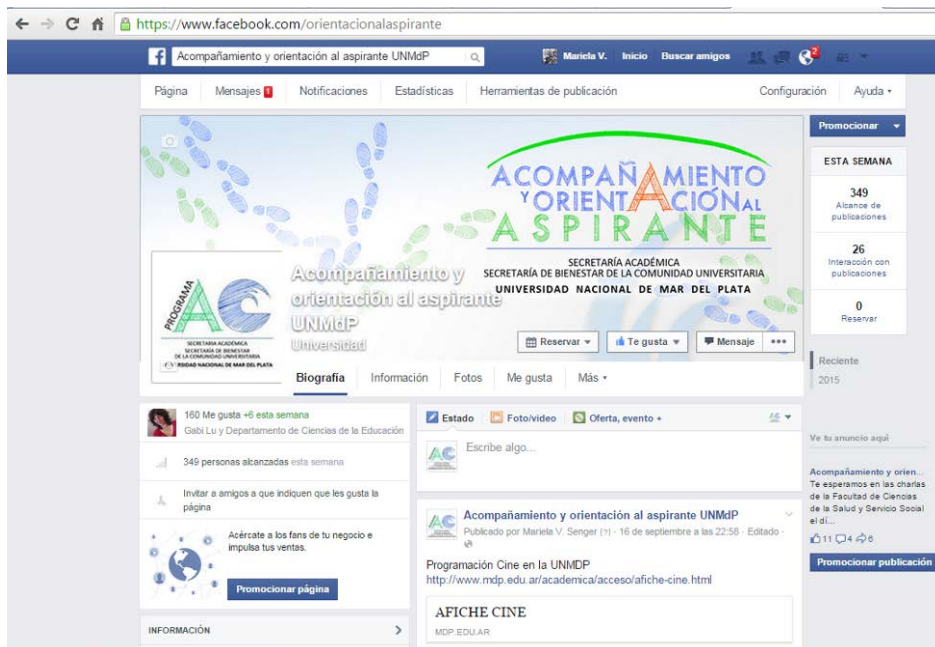
Fig. 4: Página de Facebook del Proyecto: https://www.facebook.com/orientacionalaspirante/

3) Finalidad INTERACTIVA: Para la gestión consultas, dudas e inquietudes de los aspirantes se emplearon las plataformas de Facebook y Gmail.