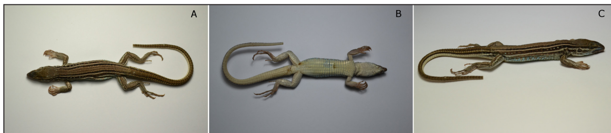
Figura 2. Vista dorsal (A), ventral (B) y dorso lateral (C) del ejemplar macho (LHC 67 mm; UNSJ-2632) de Ameivula abalosi colectado en el Departamento Valle Fértil, provincia de San Juan.

estrato arbustivo constituido por quebracho blanco ( Aspidosperma quebracho-blanco ), algarrobos ( Prosopis spp.), brea ( Cercidium praecox ), jarilla ( Larrea divaricata ) y lata ( Mimozyanthus carinatus ), entre otros; el área se encuentra perturbada por la tala y sobrepastoreo (Márquez et al. , 2014). En sintopía con A. abalosi se ha registrado la presencia de especies características del Chaco como Liolaemus chacoensis , Teius teyou y Stenocercus doellojuradoi , como también Aurivela longicauda , representante de la ecorregión del Monte.