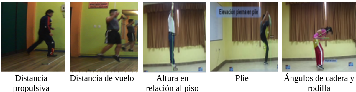
Figura 1: Gráfico de variables a ser medidas.