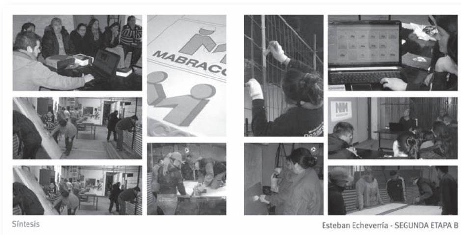
Presentación de la marca. Preparación de los materiales para la señalización interna

a paso con los trabajadores. Por otro lado, los encuentros siguientes se transformaron en jornadas de trabajo que tuvieron, también, la participación de los compañeros de Diseño Industrial. Debatimos sobre la división espacial del galpón según las áreas funcionales a las actividades de la cooperativa para plantear la comunicación de dichos espacios.