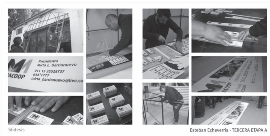
Colocación de la arquigrafía exterior. Clasificación y reflado de las tarjetas personales

No nos detendremos en la descripción exhaustiva de la situación, pero sí diremos que no todas las partes pretendían que la cooperativa se visibilizara de cara al barrio y a la comunidad, lo que significaba el despegue y la independización de la cooperativa del municipio (quien le encomendaba otras tareas). De este modo, el intento de colocación del cartel principal dejó más aún en evidencia dicha situación y debimos confrontar con un referente municipal, frente a los trabajadores, para explicar nuestra tarea