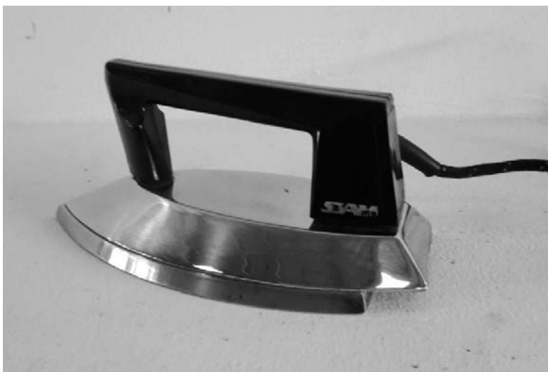
Figura 5. Imagen publicada: Summa N.º 2 (1963). Imagen primaria: Col. Fundación IDA

Es toda una declaración de principios profesionales. Pone al diseñador en un lugar institucional dentro del sistema de poder industrial y, frente a esa tensión, la empresa responde. El diseño concretiza su lugar y se define (Maldonado, 1977). El producto condiciona al usuario a la modernidad, marca un antes y un después. Y la empresa SIAM, símbolo de industria nacional, representa el capitalismo como ideología racional instituida e indiscutible (Castoriadis, 2005; Rougier & Schwarzer, 2006) [Figura 5].