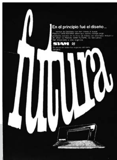
Figura 4. Revista Summa N.º 2 (octubre de 1963)

Según el paradigma funcionalista donde todo debe ser útil, el aviso impacta. El diseño (en este caso de la pieza gráfica) debe ser claro y eficiente. La tipografía de la denominación del producto está en primer plano de lectura y prácticamente ocupa el 60 % de la página (en una medición perceptual). Es, además, una tipografía minúscula pero que grita , por su exagerada dimensión y por su movilidad , ya que está curvada en ascendente e intenta fugarse del plano. También se apoya en la imagen lateral del producto, que por su tipología es su vista principal.