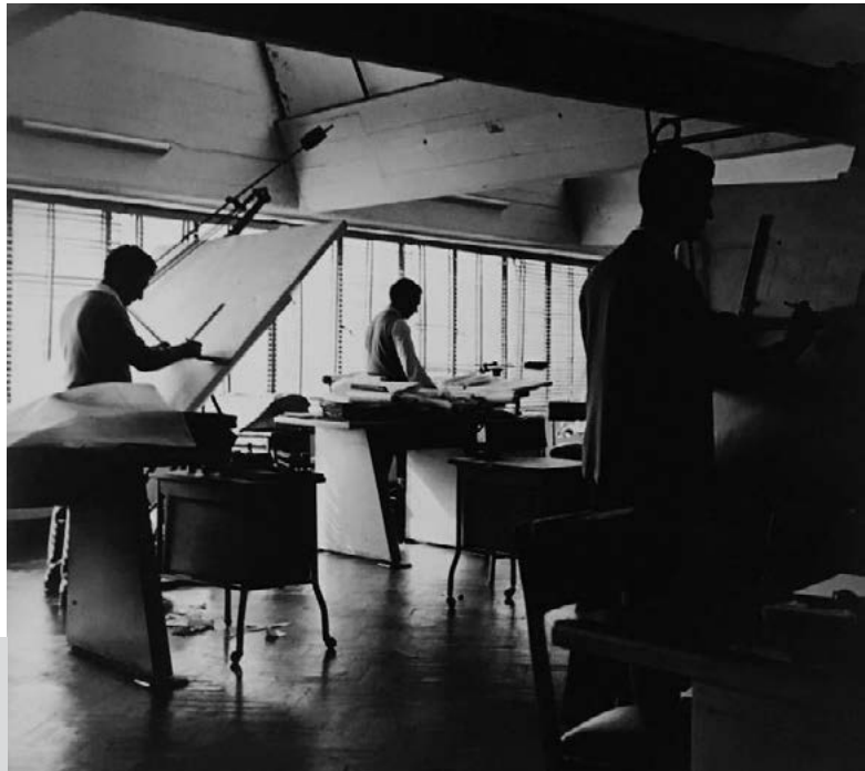
Figura 3. Departamento de Diseño SIAM (1963).

a que su padre se acercó hasta la sede de la empresa con la intención de adquirir algunos electrodomésticos, pero sin el dinero suficiente para comprarlos. «Entonces, mi padre llegó a un acuerdo: las fotos en intercambio por los electrodomésticos. Así fue que adquirimos la gran mayoría de los aparatos que tuvimos en mi casa, incluida la heladera Siam que hasta el día de hoy sigue funcionando» (Décima, 2016). En total, conserva dos mil negativos, la mitad en blanco y negro de 35 mm (la mayoría realizados con una cámara Leica) [Figura 3].