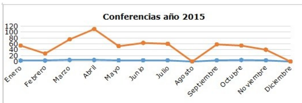
Gráfico 3. Estadística de conferencias y asistencia en el año 2015

Para el año 2016 de enero a noviembre ( Gráfico 4 ) las conferencias planificadas mensuales fueron 28, figurando en los registros de asistencia un total de 348 asistentes. Siendo mayo el de mayor asistencia registrada con 60 bibliotecarios y usuarios, para el mes de febrero y agosto se decidió no planificar conferencias, debido a un reordenamiento en la estructura organizacional de la BMN y la planificación de vacaciones de algunos especialistas.