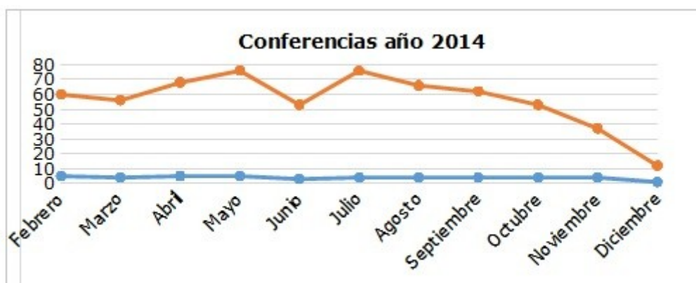
Gráfico 2. Estadística de conferencias y asistencia en el año 2014

Para el año 2015 ( Gráfico 3 ) se planificaron las conferencias mensuales, y para un total de 41 conferencias se registra un total de 593 asistentes. Siendo abril el de mayor asistencia registrada, con 110 bibliotecarios y usuarios, y con la menor asistencia los meses de febrero y agosto, este último justificado por ser la etapa vacacional en los centros educativos y personal que labora en bibliotecas.