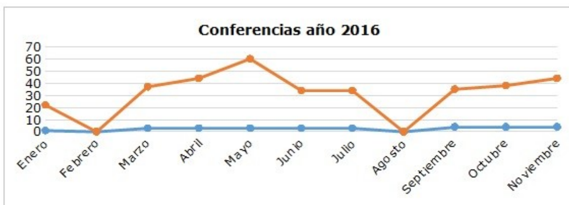
Gráfico 4. Estadística de conferencias y asistencia en el año 2016 (enero-noviembre)

Siguiendo las cifras en años es preocupante el decrecimiento en la asistencia de los bibliotecarios: cuando para el 2014 se muestra una cifra de 619 asistentes, para el 2015 una asistencia anual de 593, cerrando el año 2016 con una asistencia de 348 profesionales que asistieron para el intercambio de conocimiento y comparar contextos nacionales e internacionales en el ámbito bibliotecario.