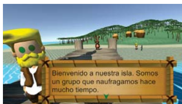
Fig. 4. Ejemplo de una de las posibles islas.

la historia que ha sido seleccionada. A continuación sigue la resolución del desafío, como puede verse en la Fig. 5 (actualmente solo existen los desafíos de tipo multiple choice y verdadero y falso), donde una vez terminado se podrá ver un feedback del resultado junto a un texto creado previamente por el docente para mostrarse como retroalimentación de la pregunta. Por último, mientras el barco abandona la isla, el juego guardará los datos correspondientes a la resolución de la pregunta y esto también se verá reflejado en el EVEA.