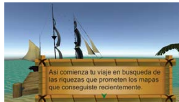
Fig. 3. Diseño del inicio de la aventura.

la historia que ha sido seleccionada. A continuación sigue la resolución del desafío, como puede verse en la Fig. 5 (actualmente solo existen los desafíos de tipo multiple choice y verdadero y falso), donde una vez terminado se podrá ver un feedback del resultado junto a un texto creado previamente por el docente para mostrarse como retroalimentación de la pregunta. Por último, mientras el barco abandona la isla, el juego guardará los datos correspondientes a la resolución de la pregunta y esto también se verá reflejado en el EVEA.