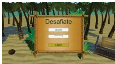
Fig. 2. Diseño del menú de inicio de sesión.