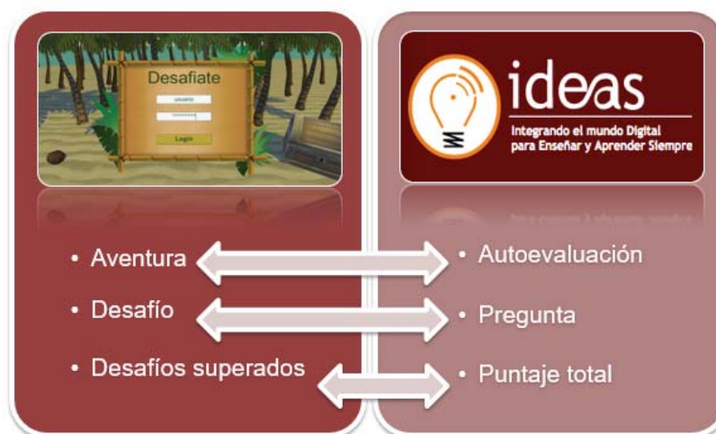
Fig. 1. Se describe en el esquema la relación que existe entre las partes de la herramienta de autoevaluación en el EVEA IDEAS y sus contrapartes en Desafiate.

necesarios para poder iniciar sesión en el sistema (Fig. 2). El diseño del menú ha sido creado para adaptarse a la temática del juego. Es por esto que los bordes han sido diseñados como cañas de azúcar atadas con hilos. Esta visual se mantendrá a lo largo de juego en todas las pantallas, incluyendo a las ventanas modales que sirven para brindar información al jugador.