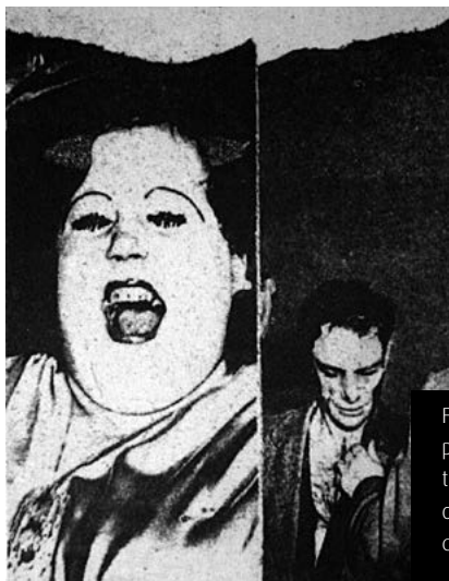
Figura 1. Prueba de estampación de plancha de cobre tratada mediante transferencia directa de tóner de fotocopia, hecha a partir de reproducciones de fotografías de Weegee 2

En estas líneas se pretende ofrecer una metodología de trabajo contrastada que facilite la investigación y la producción de gráfica contemporánea incorporando procesos de transferencia directa de tóner. En el entorno de la producción gráfica contemporánea hay un interés cada vez mayor por incorporar técnicas vinculadas a otras disciplinas. Es cada vez más evidente, por ejemplo, la asimilación de procedimientos derivados de la manipulación digital de la imagen tanto en la producción de matrices como en la obtención de híbridos entre la estampación y la impresión. Una de las preguntas que han perseguido talleres y artistas de todo el mundo es cómo vincular la imagen fotográfica con la construcción de la estampa. Por ello, surgieron —y lo siguen haciendo— diversos procesos que profundizan en aspectos técnicos y conceptuales, y que abarcan desde el heliograbado hasta las técnicas fotosensibles realizadas a partir de planchas de polímero. Cada uno tiene sus particularidades y permite lograr tipologías gráficas específicas. La transferencia de tóner es una de esas vías de investigación para fusionar la imagen fotográfica con las posibilidades calcográficas. Esto es aplicable a la transferencia de tóner y a los procesos de grabado tradicionales. En este caso, trabajamos a partir de fotocopias de tóner que, mediante diversas operaciones, trasladamos a matrices metálicas para continuar su procesado según premisas calcográficas [Figura 1].