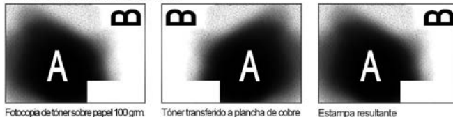
Fotocopia de tóner sobre papel 100 grm.