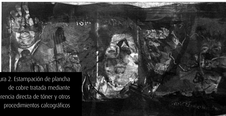
Figura 2. Estampación de plancha de cobre tratada mediante transferencia directa de tóner y otros procedimientos calcográficos

factores (González Vázquez, 2011): el valor y la permanencia del tóner en la fotocopia, y el método de transferencia. Con respecto al primero, deben usarse fotocopias recientes, de lo contrario el tóner no podrá dejar una masa estable sobre la matriz (la plancha calcográfica). Con relación al segundo, el método de transferencia, pueden señalarse dos: transferencia térmica por calor/presión (empleando papeles transfer) y dilución por disolvente. 4 Cuando hablamos de transferencia aludimos a aquellos procesos en los que se traslada el tóner de fotocopias realizadas tanto a partir de originales como de planos tridimensionales que hayan sido escaneados en una fotocopidora. Para fotocopiar contamos con el límite del peso y el tamaño que impone la fotocopidora con la que trabajamos, proceso en el que inevitablemente se incorporan los llamados «ruidos visuales» (Alcalá & Pastor, 1997). Para nosotros transferir es una parte de la amplia manipulación calcográfica a la que es posible someter una matriz calcográfica. Este proceso culminará con la estampación sobre el papel definitivo una vez que se haya culminado todo el proceso de factura de la misma [Figura 2].