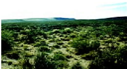
Figura 7. Localidad tipo de Liolaemus mapuche , ubicada a 15 km al Sur de Paso de Indios, provincia de Neuquén, Argentina.