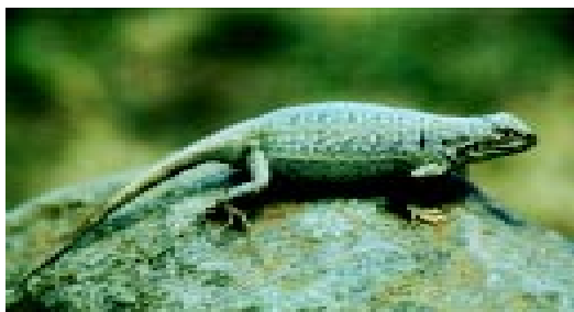
Figura 3. Hembra adulta de Liolaemus mapuche , de la localidad tipo. Presenta colores menos vistosos que en machos, destacándose el comportamiento de agrandar el tamaño del cuerpo.