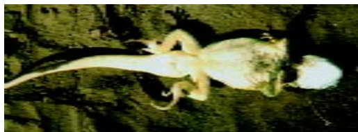
Figura 2. Vista ventral del Holotipo de Liolaemus mapuche , se acentúa el melanismo en la garganta, parte anterior del pecho y el color amarillo del abdomen, miembros anteriores, posteriores y cola.