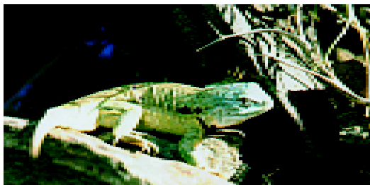
Figura 1. Holotipo, Macho adulto de Liolaemus mapuche . Se destaca el color celeste en la superficie dorsal de la cabeza, el color amarillo de la superficie dorsal del tronco, mancha postescapular más grande que la preescapular y arco negro antehumeral.