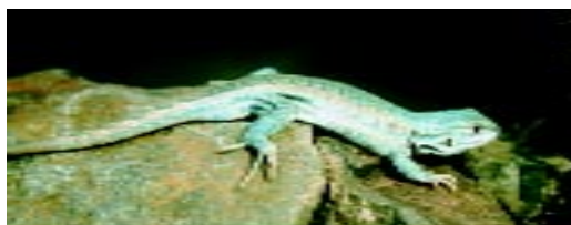
Figura 4. Macho adulto de Liolaemus mapuche , de 3 km SO de Ramón Castro con color celeste como predominante en cabeza, miembros y tronco, con tenues manchas pre y postescapulares y con bandas dorsolaterales de color pardo rojizo.