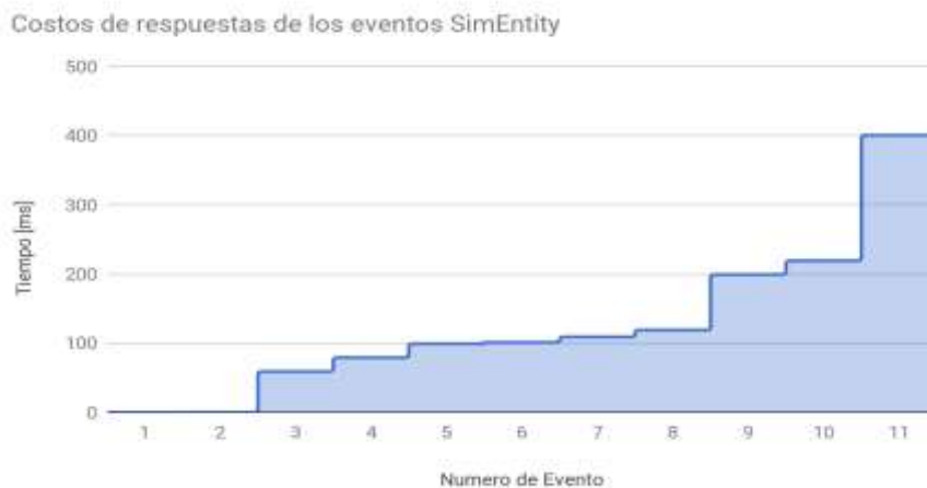
Figura 4: Comparación de los tiempos consumidos por cada respuesta de la RamEntity ante los eventos generados.

Se observa en la Figura 4 una comparación de los tiempos de respuesta obtenidos por las acciones de las SimEntity implementadas. En futuras versiones las respuestas de los tiempos se combinarán con un análisis estadístico para establecer las estimaciones de las variables temporales que se requieran.