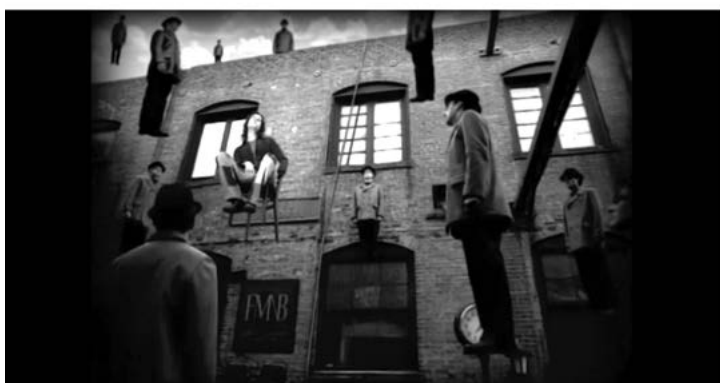
Figura 4. 70 millions (2011), Hold Your Horses! ; Applause (2013), Lady Gaga, y Across the Universe (2002), Rufus Wainwright (videoclips)