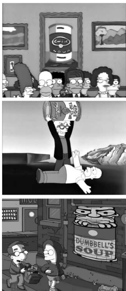
Figura 6. Los Simpson

«¡Oh no! ¡Me he convertido en un meme!» [Figura 5], parece gritar el personaje de la obra de El grito , de Munch. Un meme es una producción digital que circula en la red de internet. En general, es una reelaboración de los usuarios que combinan textos e imágenes para hacer referencia a una noticia de actualidad o a alguna idea que se quiera hacer circular. Un recurso frecuentemente utilizado es la parodia, como sucede en este ejemplo que, además, ironiza sobre su propia condición meme.