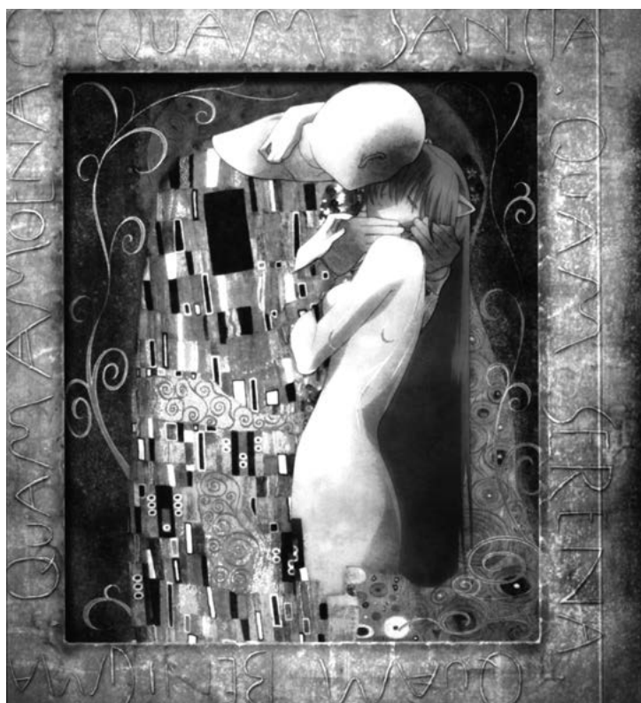
Figura 2. Elfen Lied (2004)

finalmente, cuando Elmer se topa con Tarde de domingo en la isla de la Grande Jatte , de Georges Seurat, la pintura puntillista convierte al cazador en un manojo de puntos que se esfuman cuando el conejo enciende un ventilador. Un detalle a destacar es que ninguna de estas cuatro obras de arte están exhibidas realmente en el museo del Louvre.