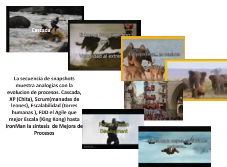
Fig. 4. Vista darwiniana de la evolución de los procesos ágiles

¿Cómo mostrar la importancia de un Proceso y la necesidad de Agile a estudiantes que sólo conocen programas pequeños? Eso debería explicarse de una forma obvia, mejor, debería ser visualmente mostrado en términos de cosas comunes que los estudiantes puedan asociar fácilmente con los conceptos subyacentes del CMMI. Los alumnos clasificaron muy alto en la dimension Visual y el par Sensitivo-Secuencial, por lo que podríamos explotar la forma en que la mayoría del grupo procesa la información. La imaginación y el darwinismo vinieron al rescate con una apuesta arriesgada: "La historia salvaje de la Evolución de Procesos de Desarrollo de Software", una película que editamos la cual explota las interacciones visuales, habituales en la comunicación de millennials de cosas divertidas, usando cualquier información disponible en YouTube.