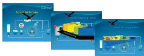
Fig. 2. Organización del Curso como un Multi-Scrum usando Representación Continua de CMMI

tipo de Scrum diario. La catarata que terminó en menos de un minuto se muestra en la Fig. 2.