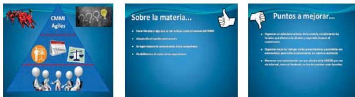
Fig. 1. Diapositivas de la Retrospectiva del curso presentadas por los alumnos

los cambios. La verdadera pregunta es: ¿cómo pueden sobrevivir los cursos universitarios de Ingeniería de Software hoy en día?