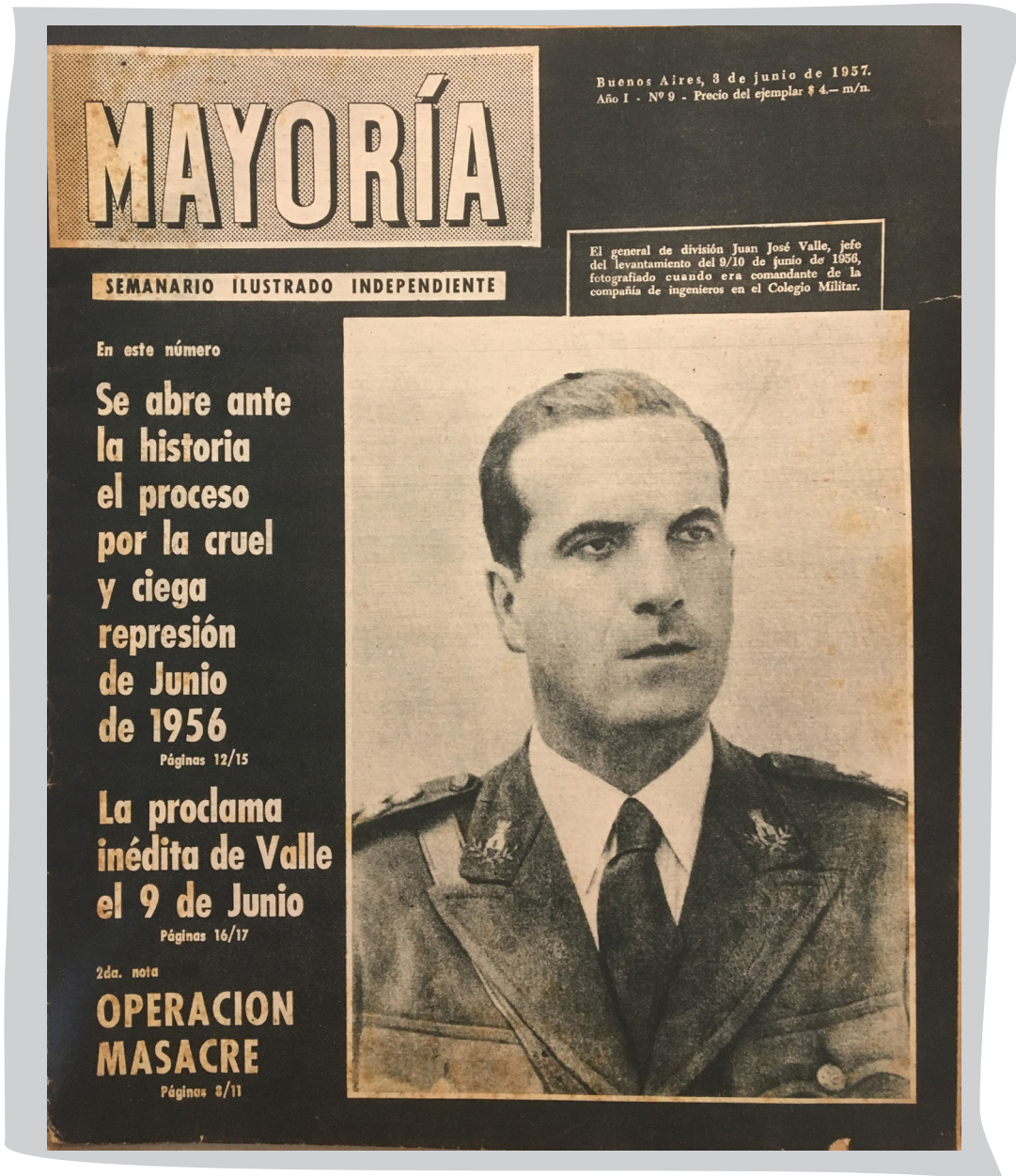
3 de junio de 1957 - Portada del número 9, edición en la que se publica la segunda entrega de la investigación «Operación MASACRE» y en la cual aparece como primicia la proclama leída al pueblo argentino, en emisiones radiales clandestinas, por los revolucionarios de junio de 1956