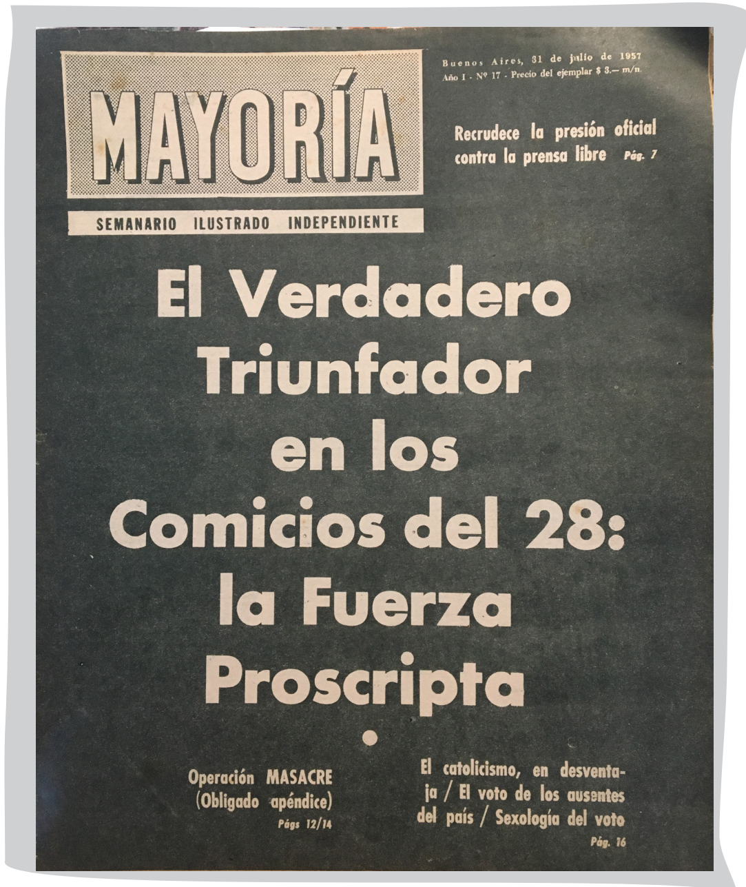
31 de julio de 1957 - Portada del número 17, edición en la que se publica la última entrega de la investigación «Operación MASACRE» que incluye un «Obligado apéndice»