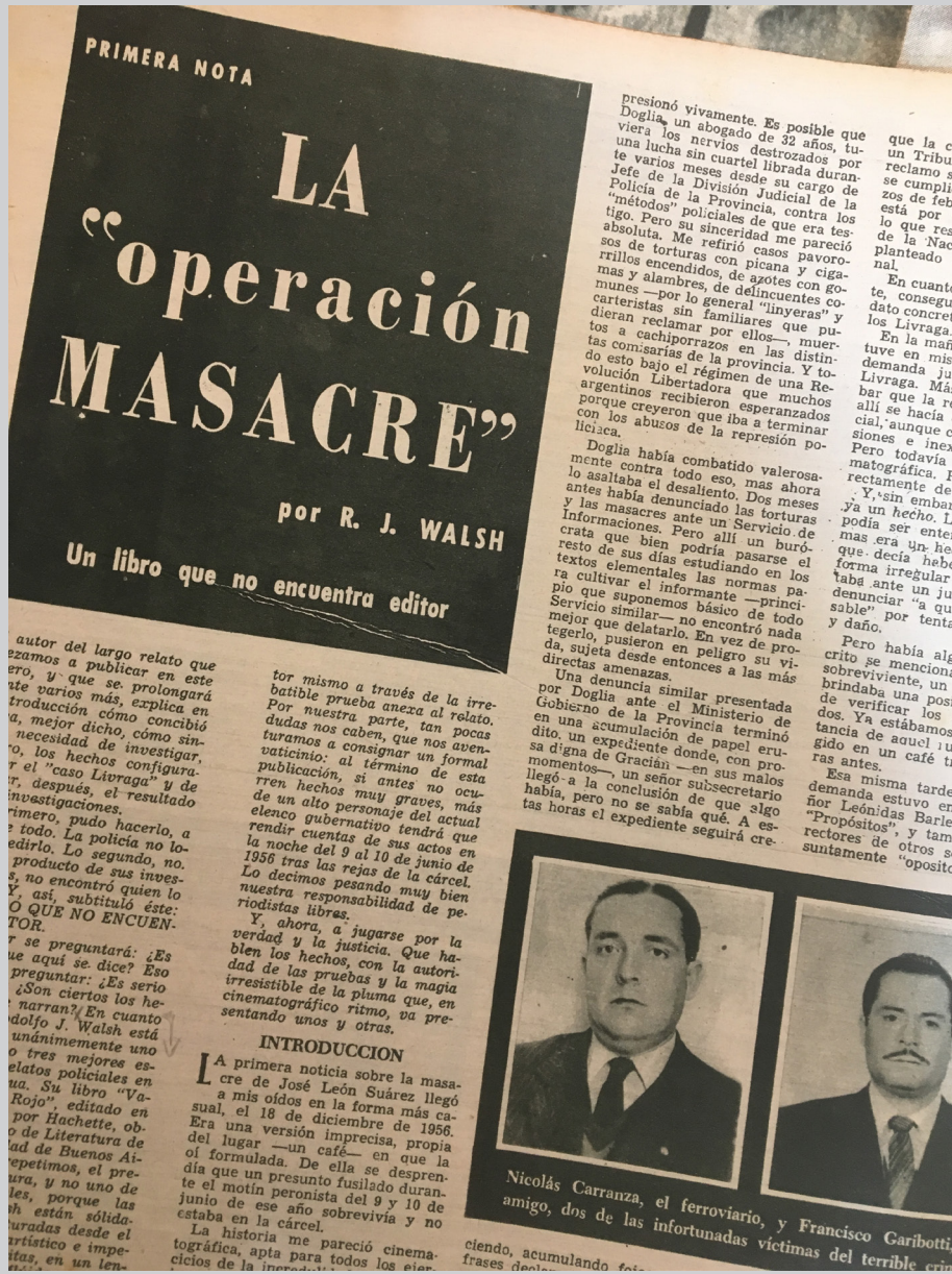
27 de mayo de 1957 - Página interior en la cual se da inicio a la serie de notas sobre «La "operación MASACRE", la indagación sobre los fusilamientos en José León Suárez, ocurridos el 9 de junio de 1956