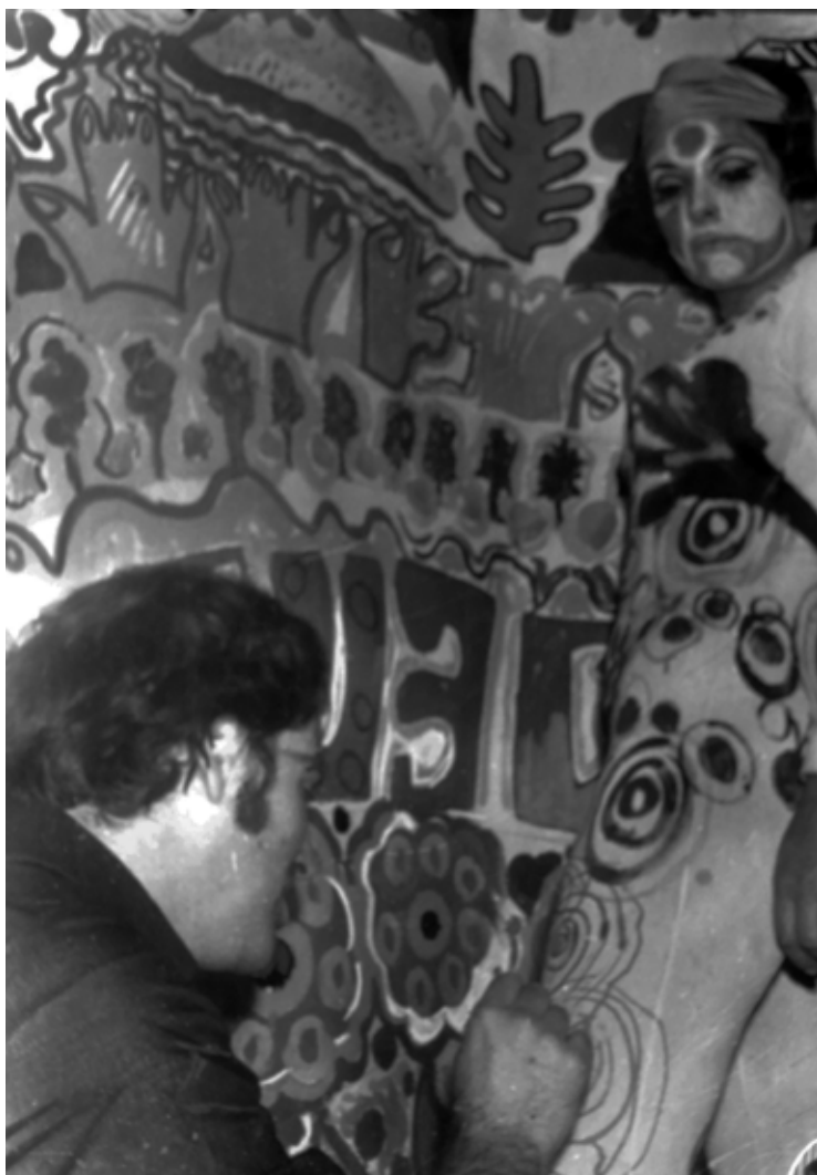
Figura 1. Arte de consumo I (1969), Luis Pazos, Héctor Puppo, Jorge de Luján Gutiérrez

de la gente observados en los registros fotográficos enmascaran el hecho de que, en realidad, la obra manifestaba una crítica a la sociedad capitalista y al mercado del arte [Figura 2]. Temáticas que, por otra parte, aún siguen vigentes en la producción de artistas contemporáneos. 4