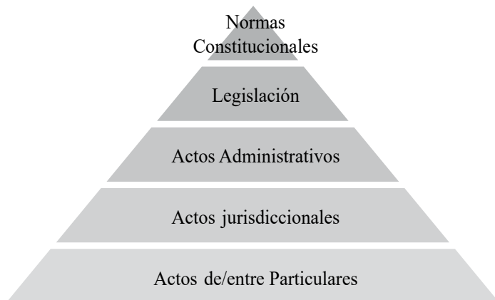
Ilustración No. 1. Sistema normativo como sistema de fuentes

Pese a que dicho orden jerárquico-funcional no es necesariamente omnicompreensivo de la totalidad de expresiones jurídicas que pueden darse en el ordenamiento colombiano, nos sirve de parámetro inicial para efectuar el estudio propuesto, dando especial atención a los escalones superiores del sistema e integrando los llamados criterios auxiliares.