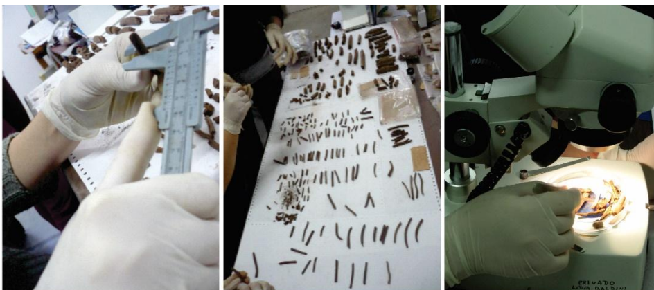
Fig. 4: Relevamiento de la colección.

En primer lugar, se desarrolló una base de datos integral del conjunto de piezas que componen la colección en formato Access, que registra sus características morfológicas, funcionales, estilísticas y dimensionales. Los materiales fueron desplegados y se realizó un trabajo de remontaje, pudiendo de esta manera asociar varios fragmentos a una misma pieza (Fig. 4). A partir de ello se clasificaron las piezas según se trate de ecofactos (objetos carentes de formatización por parte del hombre) o artefactos (aquellos que presentan algún estadio de formatización).