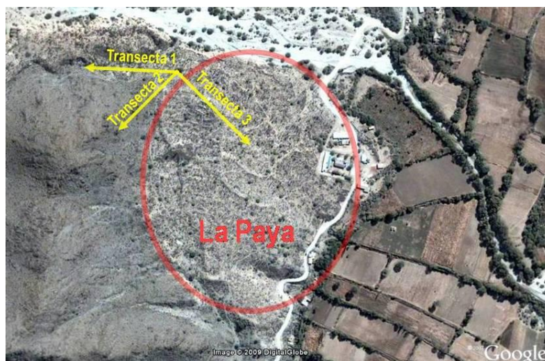
Figura 5: Ubicación de las transectas respecto al asentamiento arqueológico de La Paya.

Las actividades de campo se realizaron en las siguientes etapas: 1) se realizó una prospección de la vegetación en el área lindante a la zona de muestreo, se observó su estado de desarrollo, su floración y distribución; 2) desde el extremo NW del yacimiento arqueológico se trazaron tres transectas en diferentes direcciones buscando que atravesasen áreas con leves diferencias florísticas del entorno (Fig. 5). De cada transecta se recolectaron estructuras vegetativas, reproductivas, como también semillas y flores de especies arbustivas y arbóreas y todas aquellas que desarrollen tejido xilemático: madera.