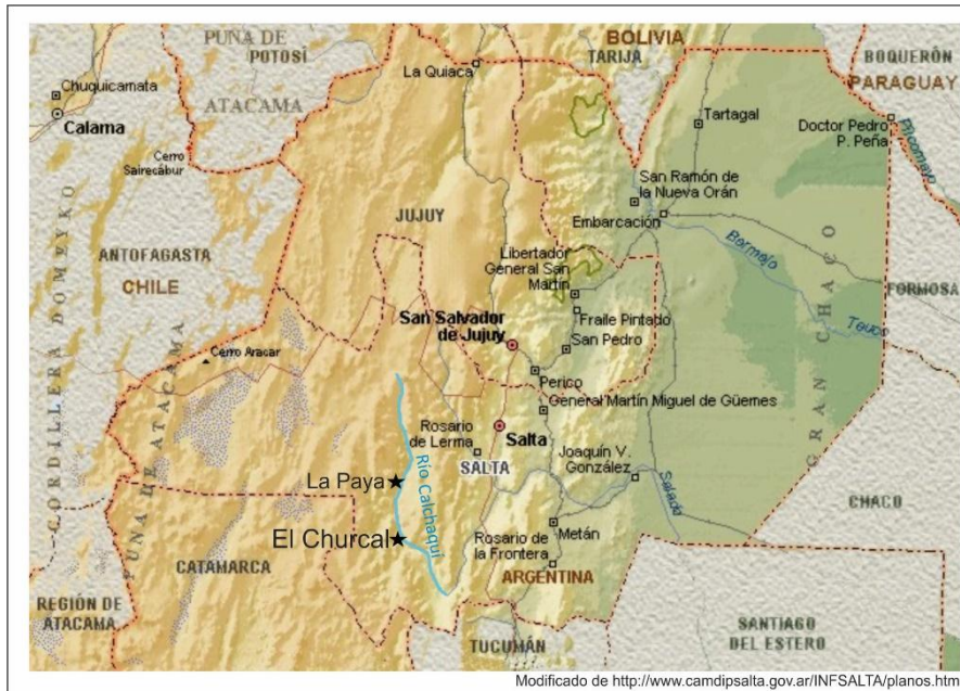
Figura 1: Mapa físico de la Provincia de Salta con ubicación del valle Calchaquí y los poblados arqueológicos mencionados.

Por este motivo se inició el estudio de esta colección con los objetivos últimos de 1) Registrar, clasificar e identificar sus piezas de madera, 2) Diagnosticar su estado de conservación, 3) Generar los procedimientos necesarios para su conservación preventiva y correcto almacenamiento y 4) Contribuir al conocimiento arqueológico de los modos de circulación y consumo de maderas en las sociedades prehispánicas del valle Calchaquí.