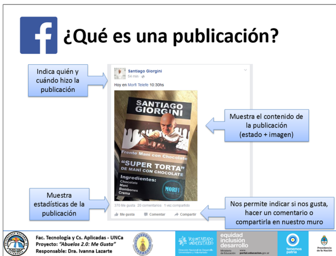
Figura 1. Diapositiva usada en los talleres de Facebook para adultos mayores.