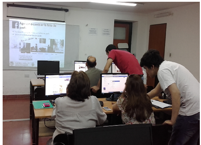
Figura 3. Estudiantes voluntarios ayudando a los alumnos del taller.