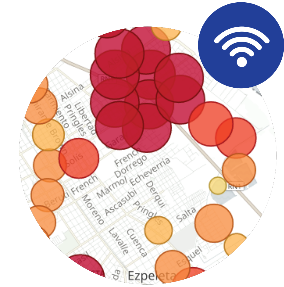
Calidad de Internet Quilmes