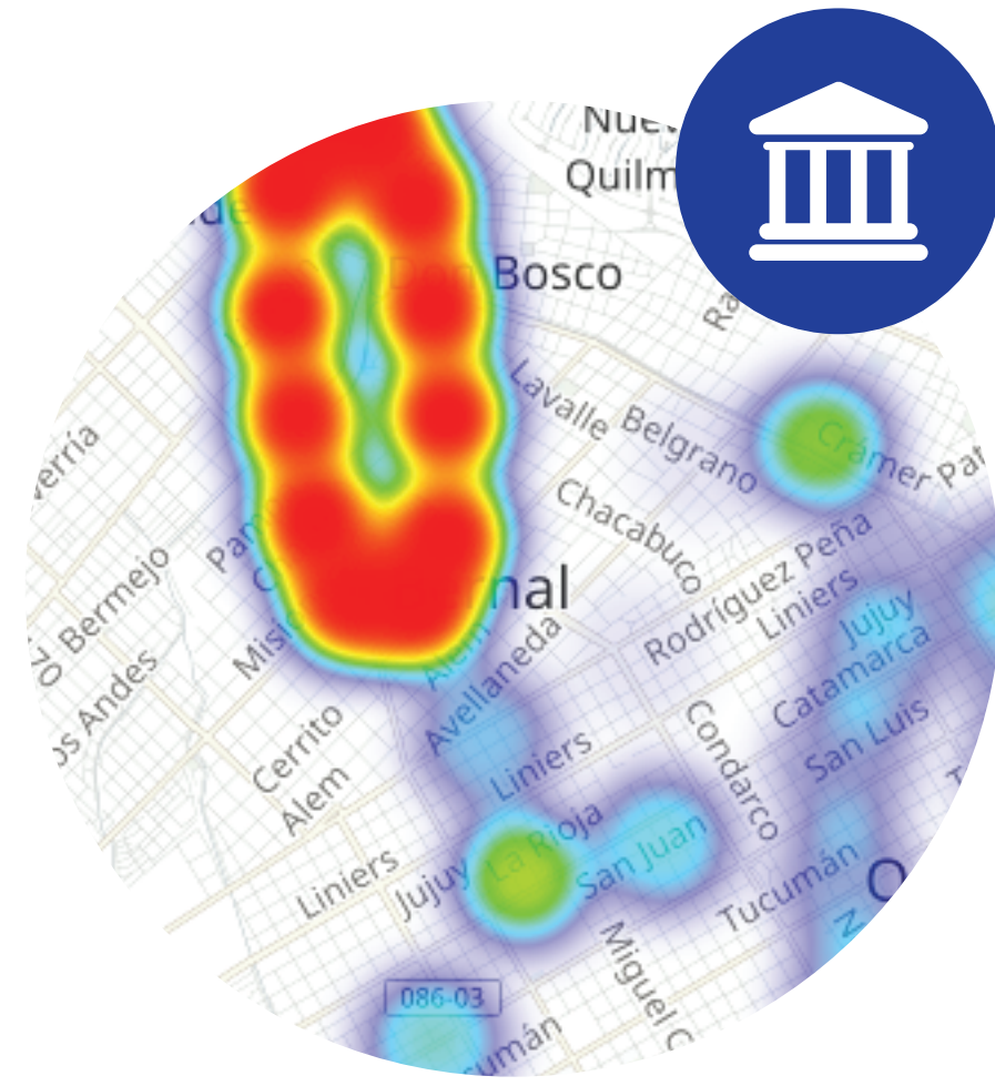
Soporte Bancario Quilmes