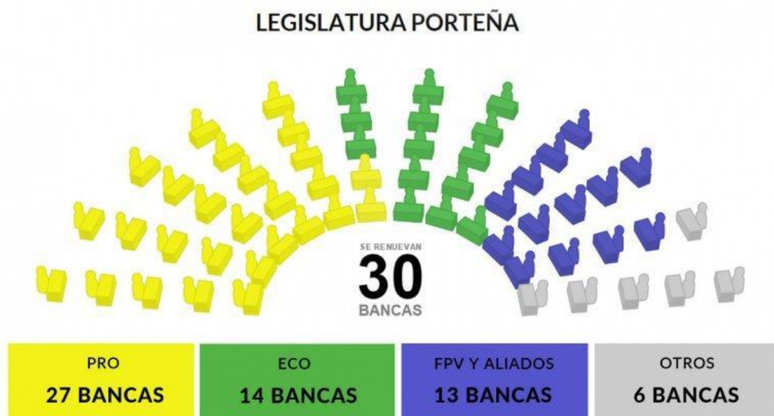
Gráfico 1: Distribución de la legislatura porteña a partir de diciembre 2015

A partir del 10 de diciembre, la Legislatura quedó distribuida de la siguiente manera: el PRO posee 27 bancas, ECO 14, el FPV 13, el FIT 3 y otros 6.