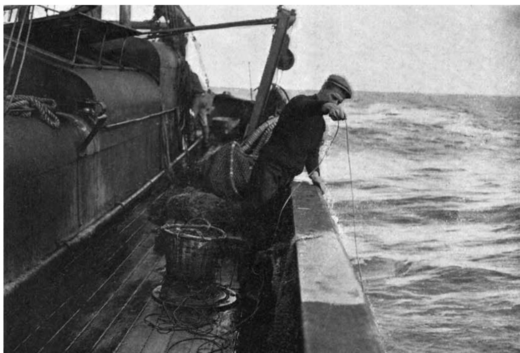
Figura 3: Medición de la profundidad antes del lance de la red (Zabala, 1910)

Al empezar sus campañas, la primera empresa pescadora encontró en abundancia peces que hasta la fecha no habían sido hallados por vivir sin duda en fondos a donde no podían alcanzarlos las pequeñas redes usadas hasta entonces por los pocos pescadores de Mar del Plata. Los peces de que hablo llamaron mucho la atención del público por su clase de coloración de un rojo subido y su cabeza armada de espinas; y como el público no compra en general sino los pescados que conoce o de los cuales ha oído hablar, la empresa pesquera bautizó a éstos con el nombre de rouget, aunque los verdaderos