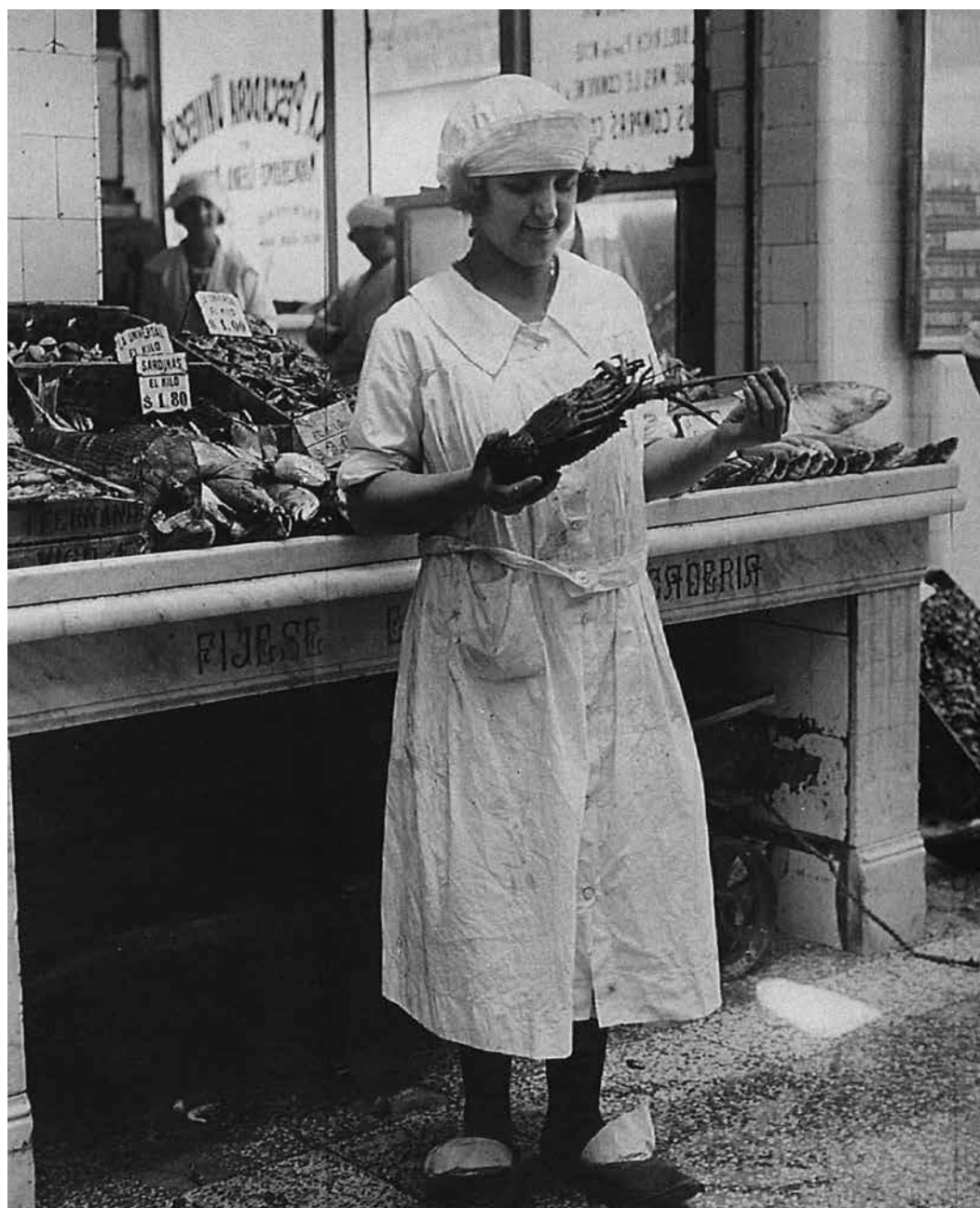
Figura 1: Puesto de pescado en un mercado de Buenos Aires (c.1924)

que serían más provechosos de coleccionar y diseccionar que comer. Durante las primeras horas de la mañana, en lugares como el Mercado del Centro, sería factible observar una pequeña muestra del mundo marino recolectada por los pescadores el día anterior. Así, el ritmo del mercado fue integrado en los patrones de las actividades de los naturalistas: las visitas matutinas a estos sitios y en las diferentes estaciones del año permitían deducir la abundancia, la estacionalidad o la aparición temporaria de ciertas especies cerca de la costa.