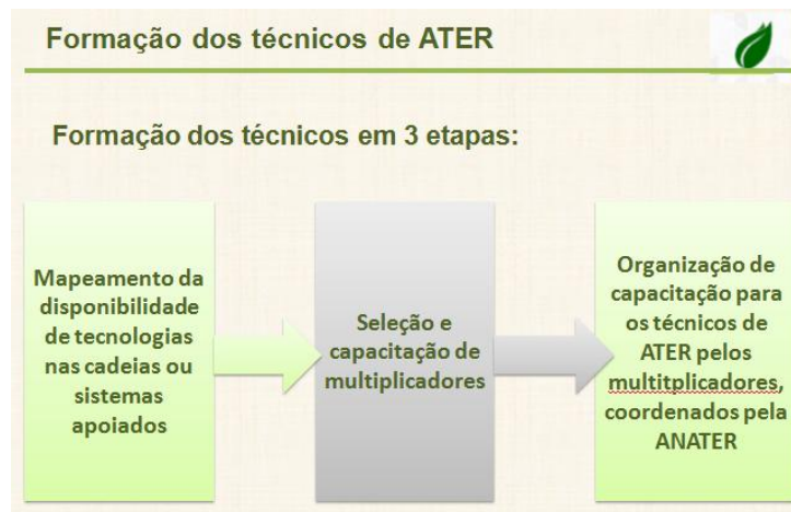
Figura 2. Concepção da ANATER sobre as etapas necessárias à capacitação dos técnicos de ATER.