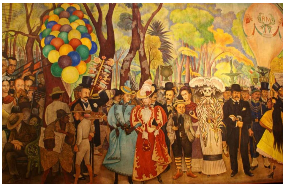
Figura 1: “Sueño de una tarde dominical en la alameda”, mural de Diego Rivera realizado en 1947.

Uno de los ejemplos más importantes en Latinoamérica, es la producción muralista que en México protagonizaron artistas como Ángel Orozco, Diego Rivera y Alfaro Siqueiros. En esos murales es posible ver representados a los grandes latifundistas miembros de la oligarquía, pequeñas comunidades campesinas, la bandera española, infraestructura francesa y las imágenes de calaveras, tradición ancestral del día de muertos. La mixtura nos impide pensar en una modernidad tardía -respecto a Europa- y homogénea, sino en procesos complejos, diferentes y, ante todo, heterogéneos. Aún hoy los procesos híbridos son las mayores riquezas, que por coerción, cohesión y consenso, construyen el palimpsesto cultural de nuestra América Latina.