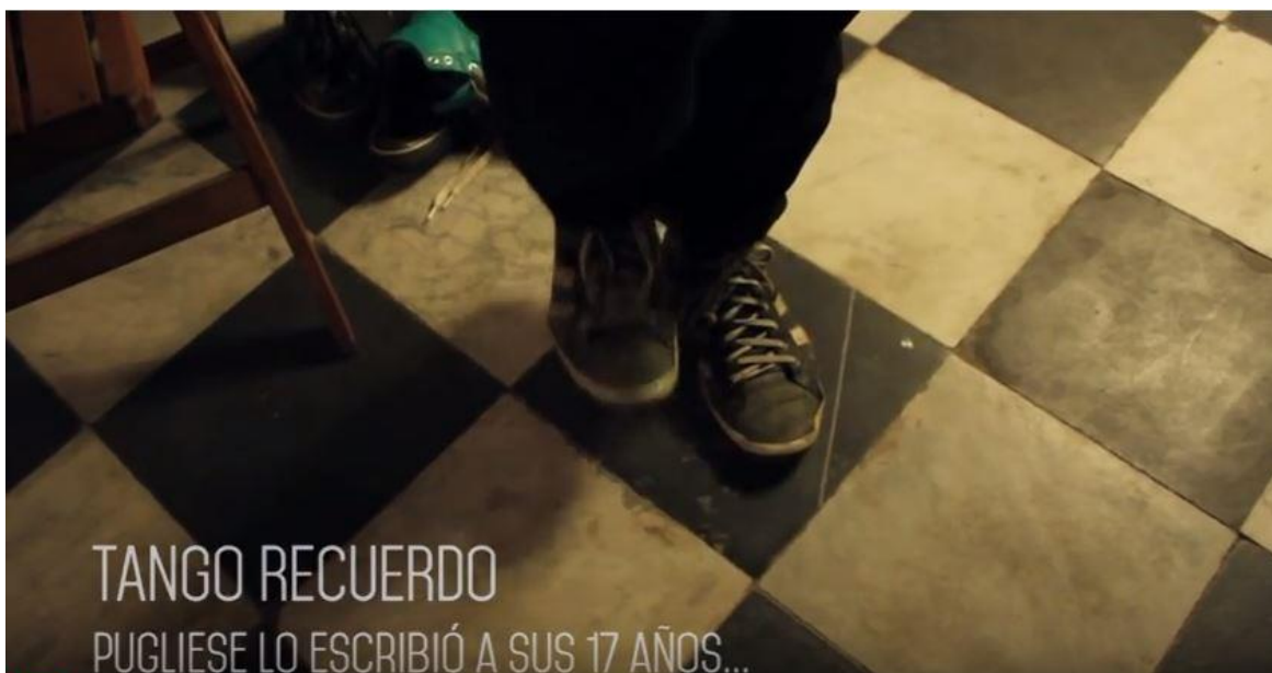
Figura 5: Imagen propia del video "#TangoNoBaja" publicado en Youtube.

En el spot #TangoNoBaja es posible analizar cómo la cuestión emocional se entrelaza con lo popular. Pero ese cruce está espectacularizado. Es contado -atención a la importancia del verbo contar- estéticamente prolijo, hay frases guionadas, planos pensados y estrategias comunicacionales, por ejemplo: se mezclan zapatos de baile de gamuza negra y roja, con zapatillas de lona que parecen ser de niños o niñas. Los personajes que se observan son jóvenes y personas adultas. Hay colibrís colgados en toda la sala y una banda tocando en vivo.