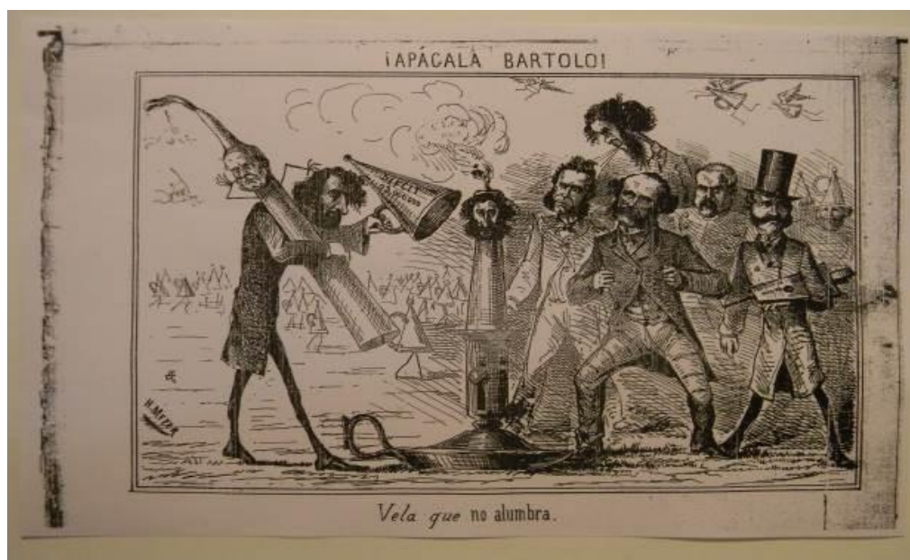
Imagen 2. El Mosquito , 27 de septiembre de 1863, 18, p. 4.

“-Dele bombo: siga la música! Decía Bartolo resollando como un padre que digiere un atracón de butifarras y haciendo unos manoteos y tantas corcovetas en el aire con las esferas, que no había ya quien pudiera decir cuál era la blanca y cuál la negra”.