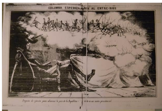
Imagen 3. El Mosquito , 25 de octubre de 1863, 23, p. 1.

“¡Soldados de todas layas! ¡Defensores de cada uno mismo! ¡Columnas del erario! ¡Apóstoles intachables de todos los partidos a que yo pertenezca! La hora del conflicto jamás os encontró despiertos. Vosotros sois los predestinados por la Providencia para despejar del berenjenal en que os habéis metido”.