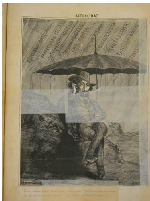
Imagen 7. El Mosquito , 3 de diciembre de 1864, 81, p. 3.

El aspecto más interesante de la caricatura política es la calma expresada por B. Mitre, a pesar de la cantidad de problemas que “lueven” sobre él. En la caricatura dedicada a la situación económica también fue utilizado el paraguas para cubrir al renunciante ministro de hacienda, Vélez Sarsfield, de los bonos y billetes emitidos en cantidad. Pero en esta ocasión ¿cuál es el paraguas del Presidente? Probablemente, su investidura, su poder, su partido político, su trayectoria militar. Sin embargo, nada puede preservarlo de la crítica de El Mosquito . La operación discursiva del periódico es muy aguda, pues le reconoce su sustento político, su prestigio militar y su sistema de prensa, es decir, lo encumbra como un importante jefe de Estado, y luego, una vez puesto es ese sitio, lo hace caer de forma sutil, al exhibirlo en una caricatura política indefenso y ocioso mientras los problemas no se solucionan. B. Mitre tiene un fuerte paraguas que le impide ser víctima de los acuciantes inconvenientes que ponían en peligro la consolidación del Estado nacional, mas su poder acababa allí, pues no era capaz de resolverlos, ni siquiera teniendo tanto poder. La estrategia de El Mosquito convierte el reconocimiento de sus virtudes, en una exposición contundente de sus incapacidades.