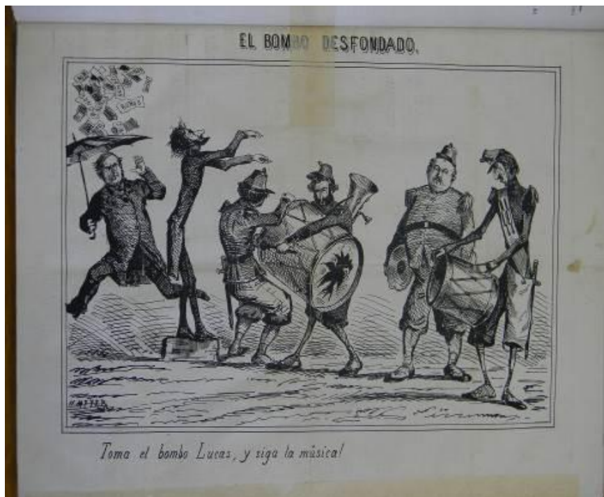
Imagen 5. El Mosquito , 5 de marzo de 1864, 42, p. 3.

Las menciones de Rufito (por Rufino de Elizalde, Ministro del Interior), Bartolo (Bartolomé Mitre) y González (Lucas Gonzáles, Ministro de Hacienda), permiten comprender con facilidad la trama de los versos. Las disputas del gobierno nacional con el Banco de la Provincia de Buenos Aires, en torno a la emisión de bonos y de billetes, y la temprana renuncia del Ministro de Hacienda, Dalmacio Vélez Sarsfield, conformaron un panorama propicio para que El Mosquito le dedicara una caricatura política denominada El bombo desfondado: