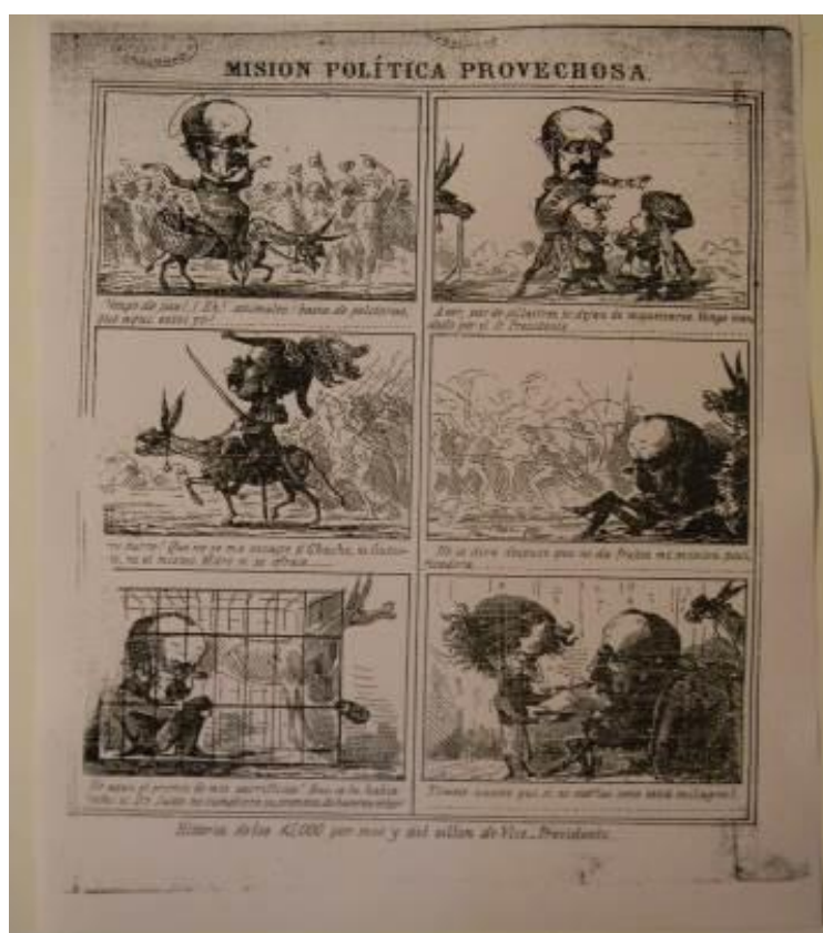
Imagen 1. El Mosquito (23 de agosto de 1863). 11, p. 2.

-Pues bien quie se forma! Y es tonto- Mirad la lámina adjunta y me dirés si digo verdad”.