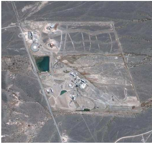
Figura 3: Emplazamiento Pampa del Cura - Departamento Iglesia