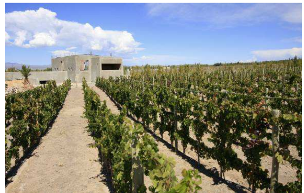
Figura 5: Proyecto “Pampa del Cura” Fuente: Arq. Héctor Muñoz Daract (Proyectista)

En lo que se refiere al aspecto económico , si bien aún no se culmina su construcción, ya se manifiestan modificaciones en la economía del Departamento, tanto por la generación de nuevas fuentes de trabajo, como por el movimiento turístico. Desde sus comienzos, el personal que trabaja en la obra es en su gran mayoría de poblados cercanos, que han sido capacitados en albañería por la empresa constructora.