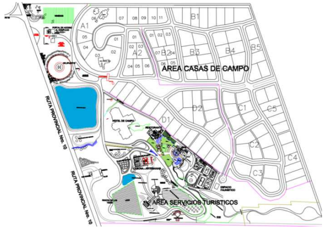
Figura 4: Plano de mensura y arquitectura: Pampas del Cura –Departamento Iglesia Fuente: Arq. Héctor Muñoz Daract

Presenta de esta manera, espacios especialmente diseñados y pensados para que el visitante pueda compartir con los lugareños sus actividades, sus relatos y leyendas, permitiendo el auto-enriquecimiento a partir de esta interacción. Esto otorga una impronta particular al producto turístico, que está en constante evolución.