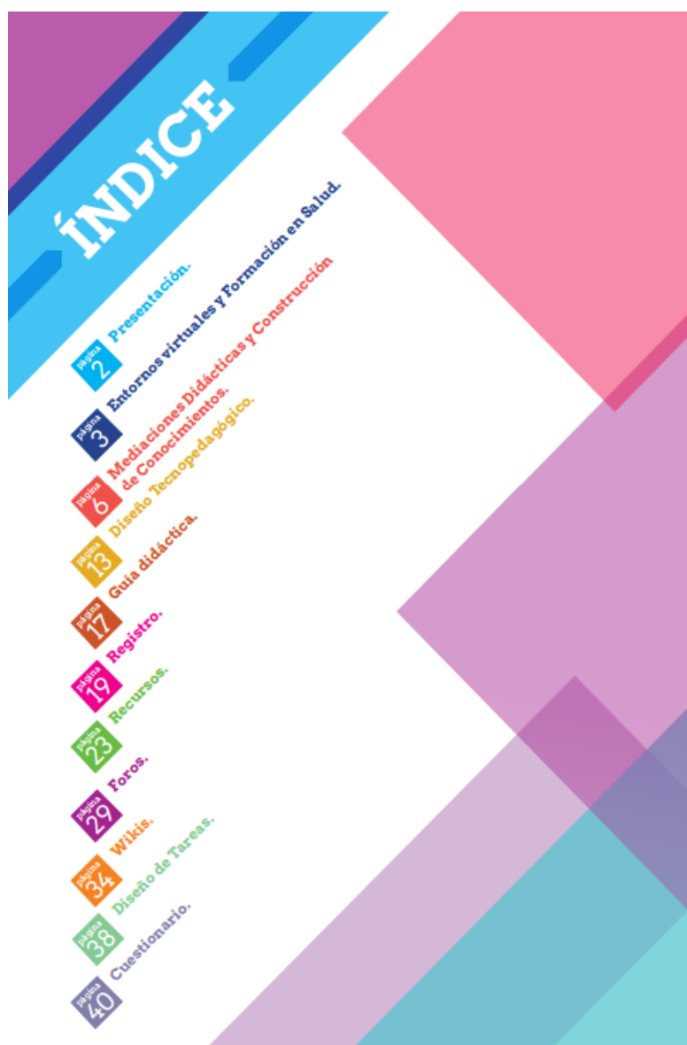
Imagen 1: índice del Dossier