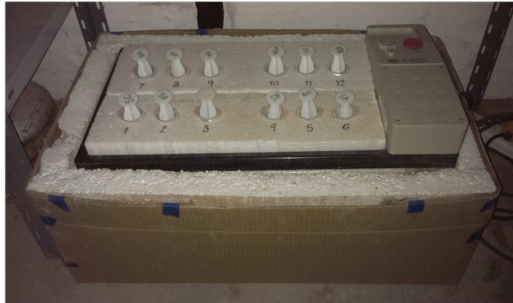
Figura 3: Baño termostatzado con aislación de EPS y jeringas listas para iniciar el ensayo.

Para el sellado del pico catéter de las jeringas se utilizó manguera de látex de 10 cm de largo: se precintaron debidamente sobre el pico y se estranguló el extremo libre asegurando su cierre hermético. En la Figura 4 se puede observar este tratamiento.