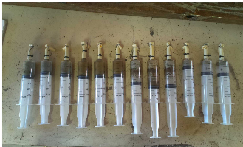
Figura 4. Jeringas una vez finalizada la biodigestión. De izquierda a derecha se encuentran las tres repeticiones de cada variante 5X, 10X, 15X y SX.

Es de destacar que en ningún caso se utilizó inóculo. La Variante 4 “SX” podría considerarse como digestión en estado seco, ya que el contenido de sólidos totales, igual a 40,9%, es mayor a 15% (Li y Zhu, 2011). Bajo el mismo régimen de clasificación, las otras variantes se consideran digestiones en estado líquido.