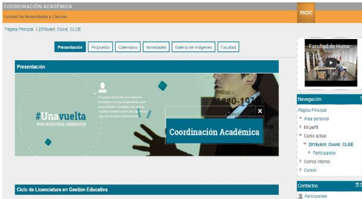
fig. 1. Ambiente de Coordinación Académica. Secciones.

Se propone el tratamiento de toda la información que se considera “noticia” o “novedad”, a la que el alumno debe acceder en forma frecuente. Se trabajan a través del recurso “etiqueta” del ambiente virtual.