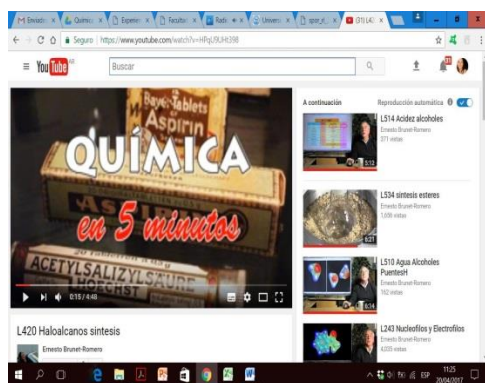
Figura 1: Captura de pantalla del video introductorio.

3. Con el fin de integrar aspectos cognitivos, se propone un cuestionario. Los alumnos debieron responder utilizando para ello los conceptos desarrollados en el video introductorio, el material didáctico de la cátedra y la bibliografía recomendada.