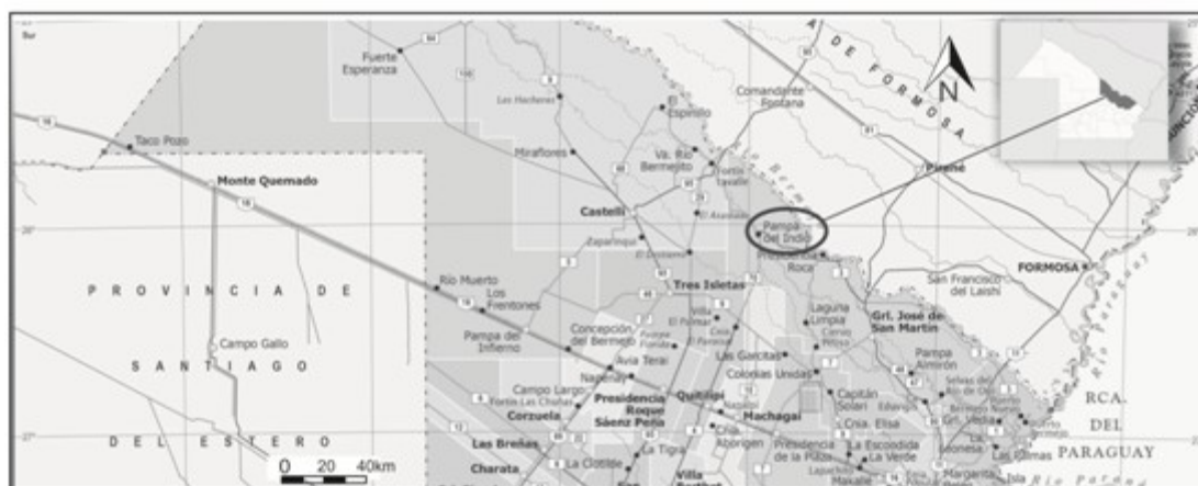
Figura 1. Ubicación de Pampa del Indio, provincia de Chaco (Argentina)