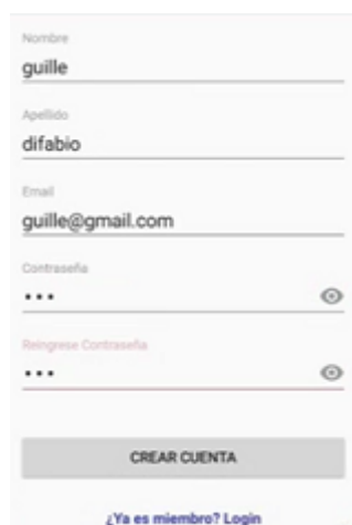
Fig. 2. Captura de pantalla de registro de usuario.

Se implementó un módulo para registrar a los usuarios que ofrecen sus servicios. En la figura 2 se presenta la información que posee el dispositivo móvil.