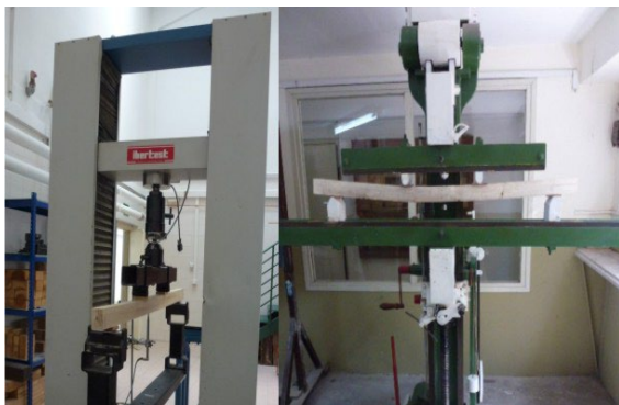
Figura 3. Máquinas de ensayos destructivos España (Izq.), Argentina (Der.).