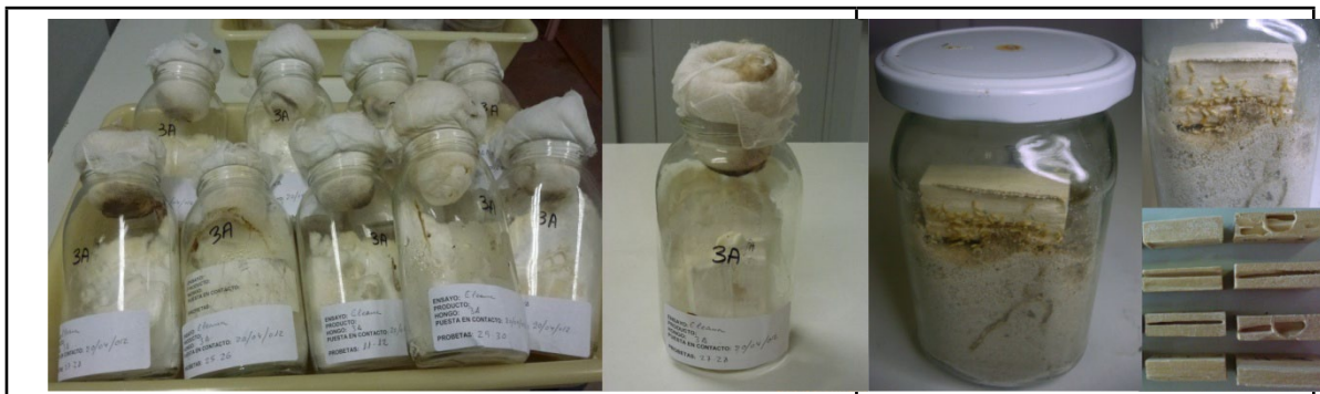
Figura 2. Ensayo con hongos xilófagos (Izq.), con termitas (Der.).