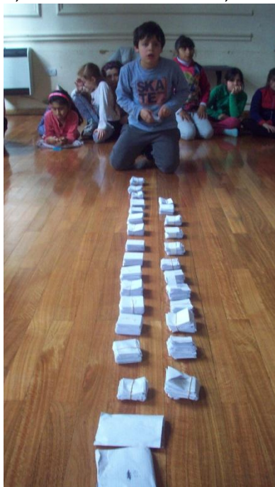
Imagen 1: Salón de Teatro

En la escuela, ya comenzábamos a trabajar con los proyectos por disciplina -Expresión Corporal, Literatura, Plástica Bidimensional, Plástica Tridimensional, Música, Teatro-.