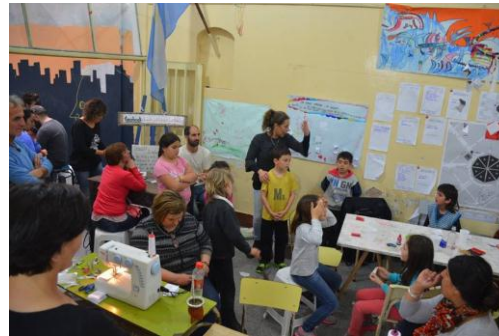
Imagen 2: Jornada de Pre-montaje

Se realizaron dos jornadas de costura y pre-montaje junto a las familias. Ambas con amplia concurrencia, así como también las asambleas organizativas donde dividimos y asignamos coordinadores por sección donde había dos docentes y una familia asignada o un colectivo participante.