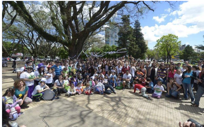
Imagen 4: 22 de Octubre, intervención

Montamos espacios para escribir o dibujar pensares y sensaciones durante el transcurso de la mañana, emplazados en las rejas de la escultura de la plaza. El único episodio manifiestamente divergente ocurrió cuando una mujer se acercó a preguntar qué estábamos haciendo y se quejó de la actividad. Otras personas que pasaban se interesaban de forma positiva con la intervención y participaban activamente. Alrededor de las doce del medio día, habíamos terminado de montar los sobres en la plaza Rocha.